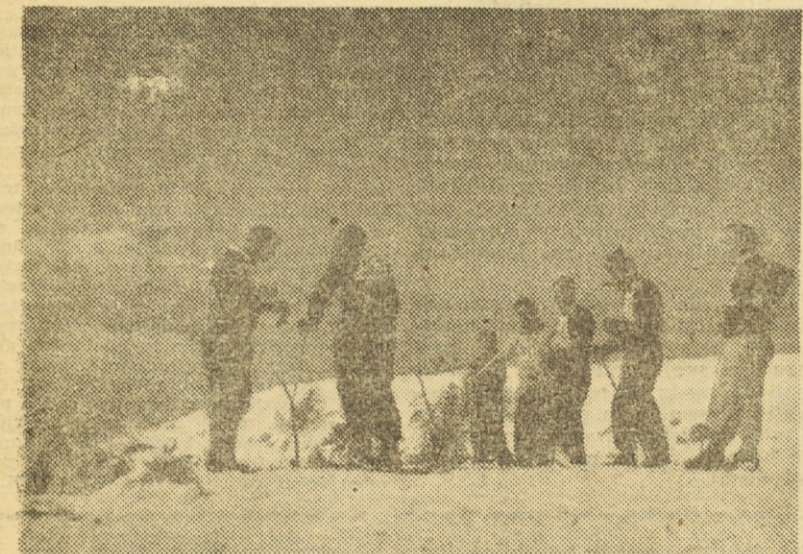
Člani »Fužinarja« na startu z Uršlje gore (veleslalom z dne 28. marca)

Na griču nad železarno se dviga, obdana od gozdov, lepa graščina. Nekoč so se tu košatili plemenitaši, ki so bili tudi lastniki železarne. Danes seveda grofov ni več, ostalo je le še poslopje, ki ga preurejujejo v muzej, in pa park, ki ga ohranil le redke sledove nekdanje lepote. Sredi košatih gozdov, kjer so se nekoč izprehajali razni baroni, grofi in druga gospoda, se danes poganjajo za žogo ravenski nogometaši in telovadilci tamkajšnjega partizanskega društva.