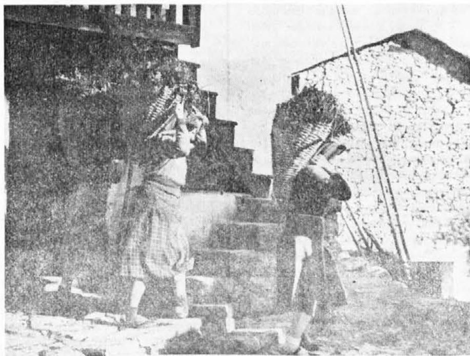
TAKO SI NAŠE ŽENE MORAJO SLUZITI KRUH

Anjelé, ke so pokomodali cjesto an narditi plačal, kjer bojo mogli stati makinarihi za uartanje, je postalo vse tiho. Maje dan več u ne pride u te kraj djelat prožete kako to bo šlo djelo indavant an še giornalji mouče. Če do pomladi ne bojo začeli z djeli, si lahko izbujemo iz glave naše šperanče, de bi paršli orovi časi za Vizont. Najbuj sigurno se nam parkazuje emigracija, ke na e usaki dan buj velika tud u naših vaseh.