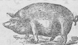
znamenka sva sva

Pozor! Ta praščiji prašek in Kakao sladni čaj dobite tudi v vseh prodajalnicah, če pa ne, potem po pošti.