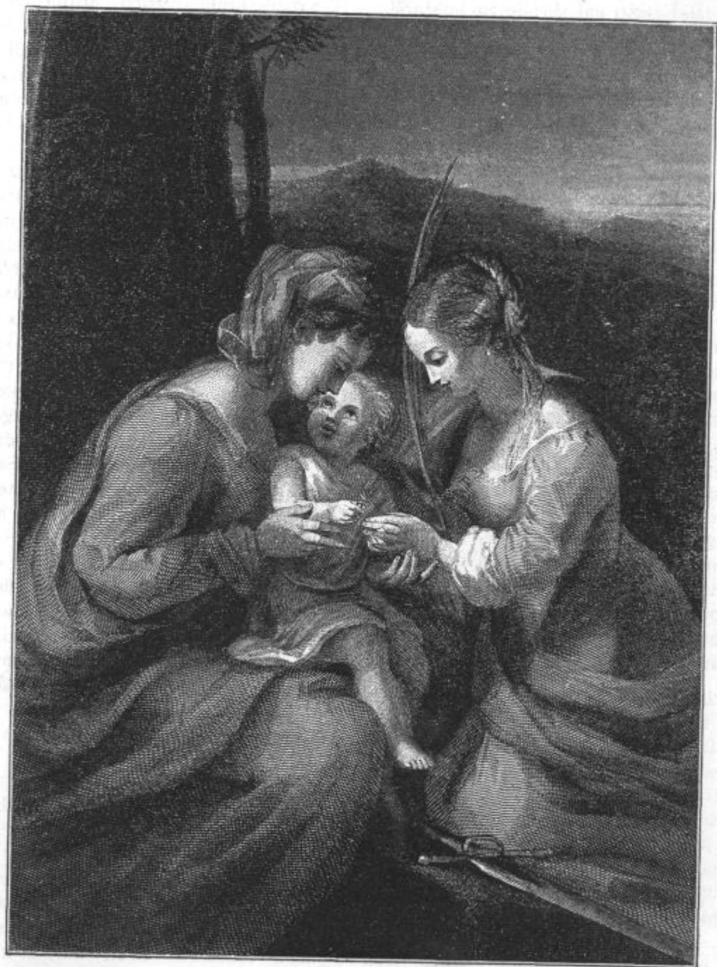
Poroka sv. Katarine.