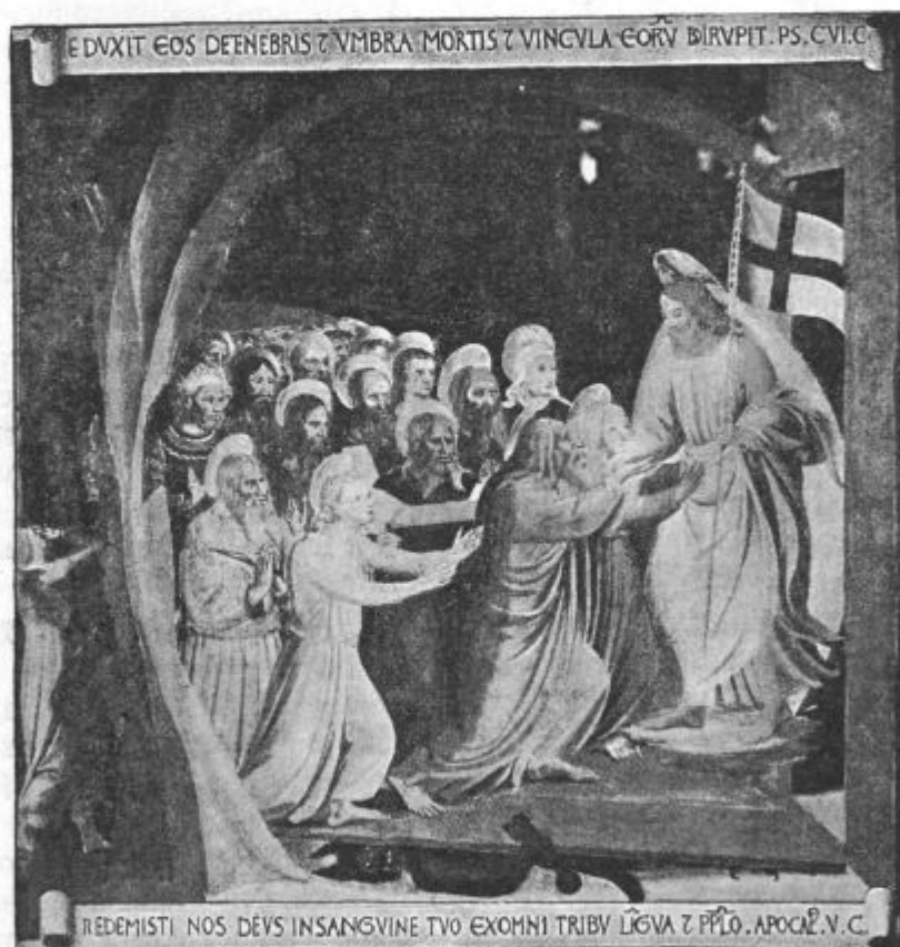
Kristus pred peklom. Slikal Fra Angelico.

zdržati solz, tako, da ga je moral sam Tomaž tolažiti. Da se je mogel vrniti v svojo zaduhlo ječo, se je moral peljati Tomaž po reki Temzi; na stopnicah, ki so vodile doli k reki, ga je čakal njegov sin Janez. Ta do-bri sin je podedoval po očetu zvesto srce in trdno vero. Stanoval je ob tistem času da-leč proč od Londona, pa je zato celo noč pre-hodil, da bi še prejel zadnji blagoslov očetov. Glej, tu se je preril skozi množico k na smrt obsojenemu očetu. Oče ga je blagoslovil in