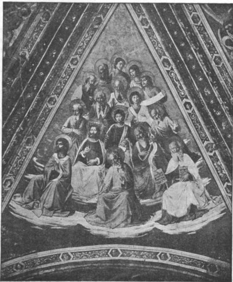
Zbor prerokov. (V Orvietu.) Slikal Fra Angelico.

5. Kot otroci naj družabnice svojim starišem nikoli ne napravljajo žalosti in jeze;