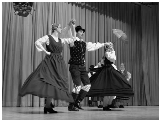
Podoba pripadnostnega kostumiranja Gorenjcev, ki pri moškem vključuje oblačenje belih bombažnih spodnjih hlač, vidnih v delu okrog kolena. Folklorna skupina iz Bohinja na območnem srečanju folklornih skupin.