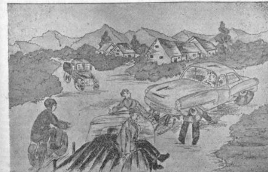
Takole je upodobila prometno nesrečo (risba je bila nagrajena) učenka iz Zaleca

»Vozil sem previdno... pijan nisem... ne-