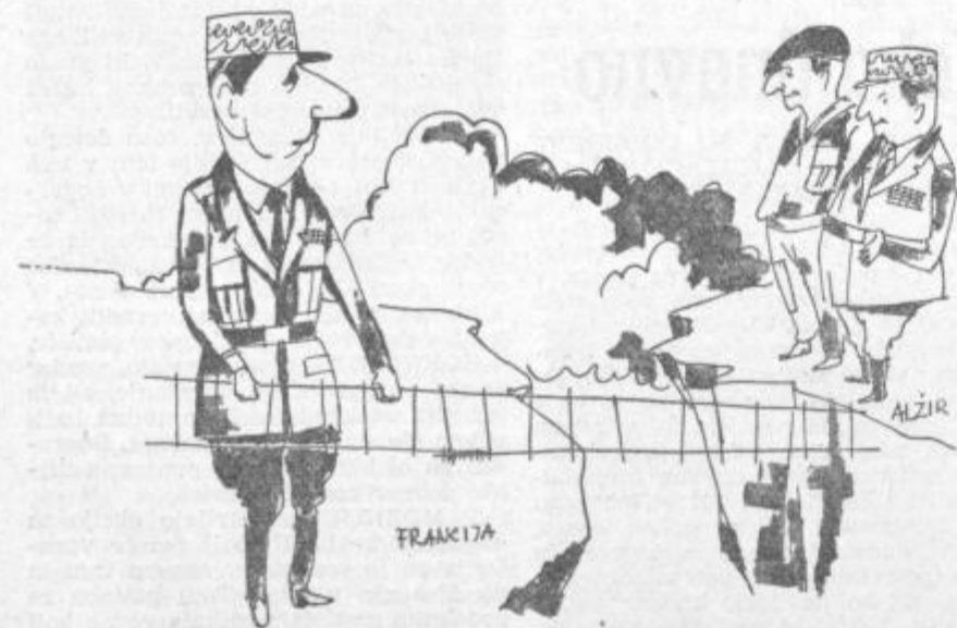
DOBRI PASTIR DE GAULLE

Trg. podjetje »Hmeljar«, Petrovčeve sprejme za poslovalnico L i b o j e TRGOVSKEGA POMOČNIKA all POMOČNICO.