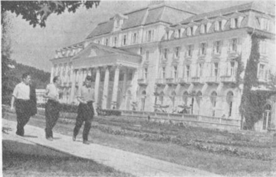
Zdraviliški dom v Rogaški Slatini. V njem si naši delovni ljudje pridobivajo novih moči.