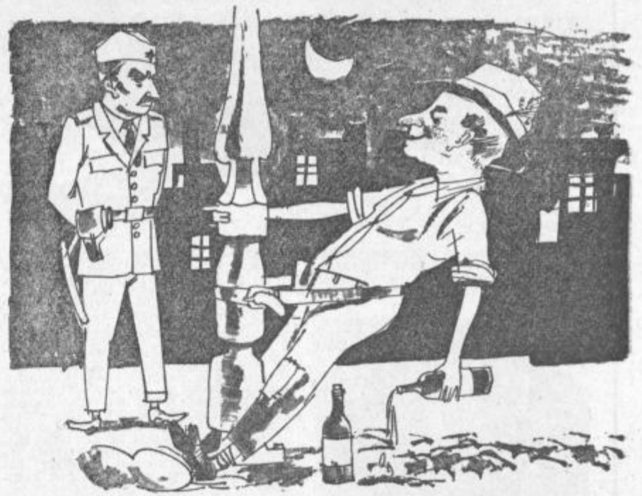
— Hk... ali ne... hk... to... tovariš miličnik, da bo letošnja suša hudo prizadela naše gospodarstvo... hk... —