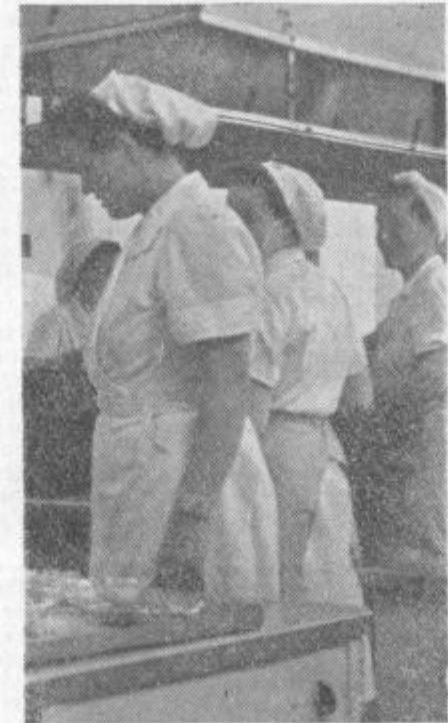
Delo v kuhinji zahteva spretnih rok. Gostje čakajo na kosilo in urno se je treba zasukati.