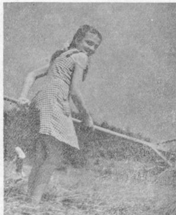
Košnja in sušenje, to je bilo glavno opravilo na podeželju v teh dneh. Res je zaradi suše bila trava ponekod že kar preveč rumena in v slamnatih stebelcih, toda sušila se je dobro in hitro. Zdaj pa, ko je prineslo »odrešilni« dež, ki kar lepo vztrajno pada, bodo morali počakati tisti, ki še niso naklepal kos...