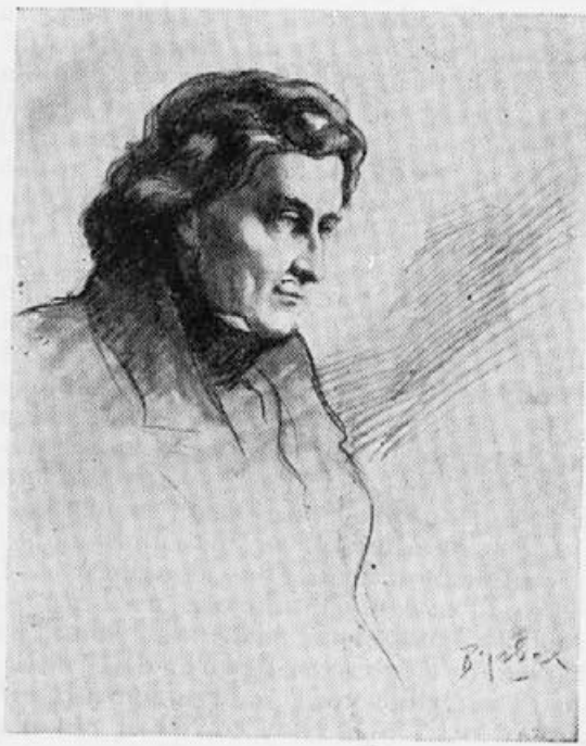
Dr. FRANCÉ PREŠEREN