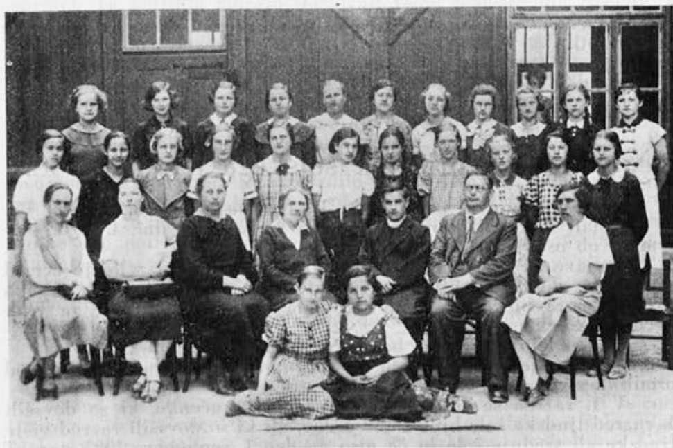
Učiteljski zbor in učenke IV.b razreda.