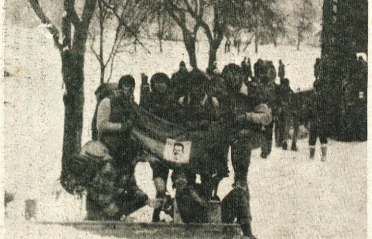
Vsi zadovoljni in zdravi, če odštejemo tistih nekaj žuljev.

Drugi dan so iz Poljan čez Javorje, Stari... vrh, (kjer so na veliko začudenje... smučalci kar v »gozdarjih«). Čez... Rout prispeli do Železnikov. Tu pa so... imeli srečo, saj jim je prijazen... domačin ponudil prenočišče ob topli... kmečki peči in fantje se ga niso... brani.