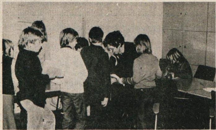
Vsakokrat so take vrste za vpis novih vlog

Na Klancu so se krajani lani septembra odločili, da si uredijo kanalizacijo in slabe makadamske ceste. Prvoten predračun je bil 970 tisoč dinarjev, vendar je sedaj ob zaključku vrednost teh del narasla na preko 1,5 milijona dinarjev, predvsem zaradi večjega obsega del in tudi zaradi nekaterih podražitev. Pretežni del denarja so zbrali sami, saj je vsako gospodinjstvo prispevalo med 35 in 50 tisoč dinarjev (razen redkih izjem), nekoliko manj pa upokojevc. Poleg tega, so krajani sami opravili še preko 2700 prostovoljnih delovnih ur. Na pomoč jim je priskočila Industrija usnja s 400 tisoč dolarji. Asfaltirali so okrog 300 m slabih makadamskih poti, pa uredili tudi kanalizacijsko omrežje. Na Klancu pravijo sedaj ni hiše, ki ne bi bila povezana na kanalizacijo. Isti so nekateri zamenjali tudi vodne cevi in priključke, ki so jih tudi sami plačali. Akcija je uspela predvsem zaradi sodelovanja in razumevanja vseh ljudi, ki so jih posnemati.