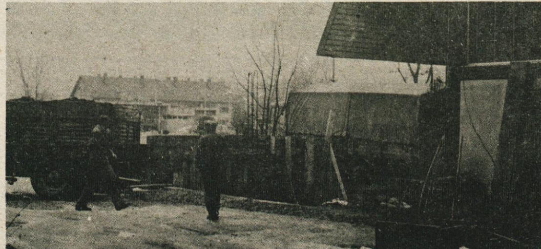
Skladniških prostorov ni nikdar preveč. Tudi Mercatorjeva trgovina na križišču jih ima kar premalo, zato računajo, da bo letos spomladi, ko bo dograjen prizidek le nekoliko bolje, saj bo to vplivalo tudi na boljšo založenost.