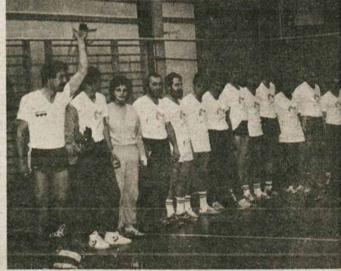
EKSHIBICIJSKA TEKMA ZLATE SELEKCIJE IN KARTISTOV SLOVENIJE