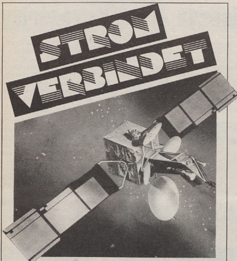
im KELAG-Pavillon auf der Klagenfurter Messe 18. - 26. August 1990