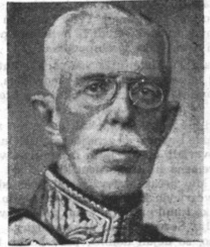
Švedski kralj Gustav V.