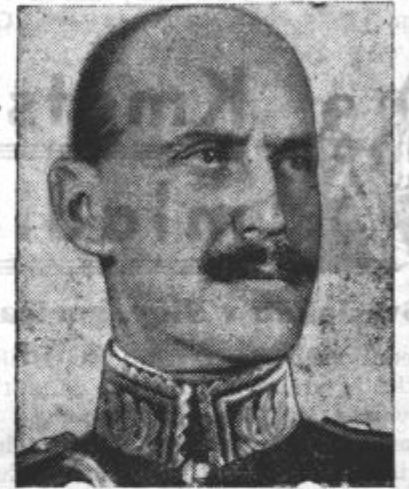
Norveški kralj Haakon VII.