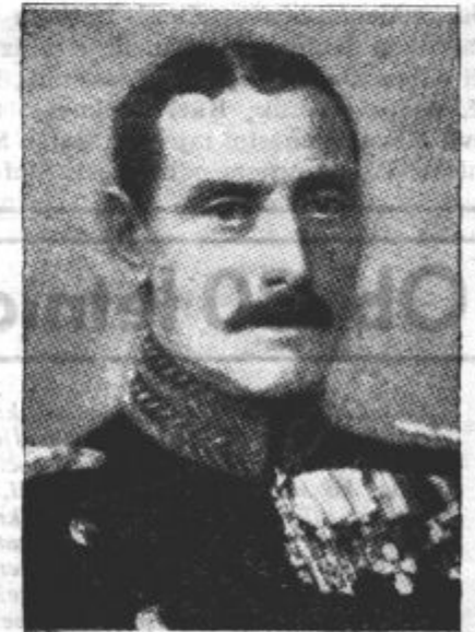
Danski kralj Kristijan