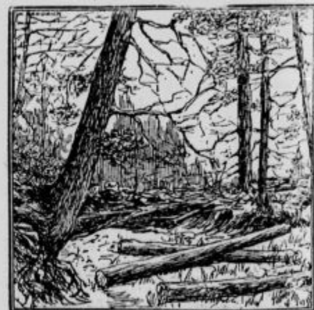
Kje je drvar?