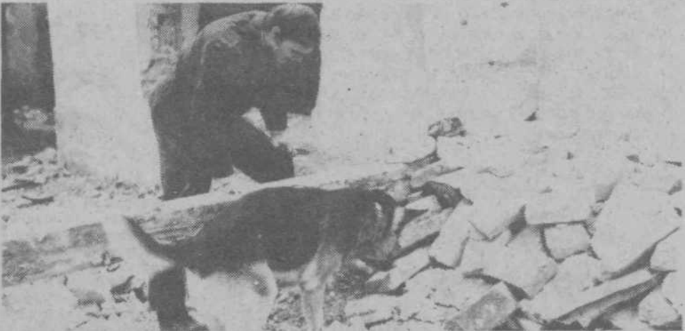
Muri je z mahajočim repom pokazal, da je našel ponesrečenca.

Pri povezovanju z mladino imajo različne izkušnje, nobene dvoma pa ni, da morajo komunisti v krajevnih skupnostih še okrepiti svoje delo v socialistični zvezi, vzpodbuditi aktivnosti delegacij in, kot je izvenelo ob koncu razgovora, vse več pozornosti nameniti liku komunistov. Danes je še posebej pomembno, kako se obnašajo člani Zveze komunistov, kakšen zgled dajejo s svojim vsakodnevnim življenjem in kako prenašajo v prakso svoje misli in besede z raznih sestankov.