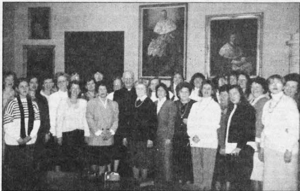
Sprejem pri nadškofu dr. Alojziju Šuštarju.