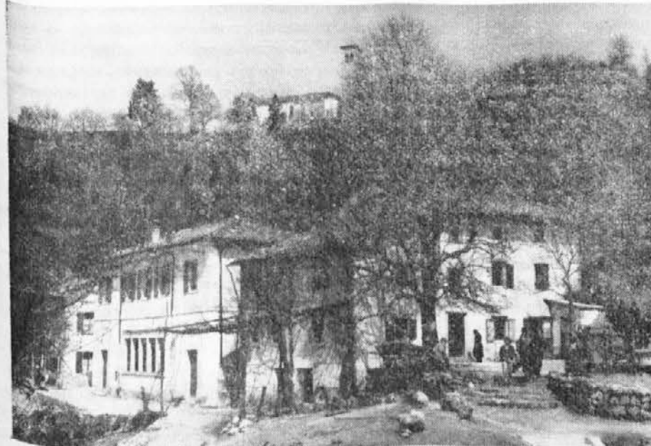
KRAS PRI DREKI

Da bi ustavili dramatičen beg z zemlje v hribovskih krajih province so potrebni dramatični ukrepi in ne palliativi bonifikacijskih zakonov na dolga leta.