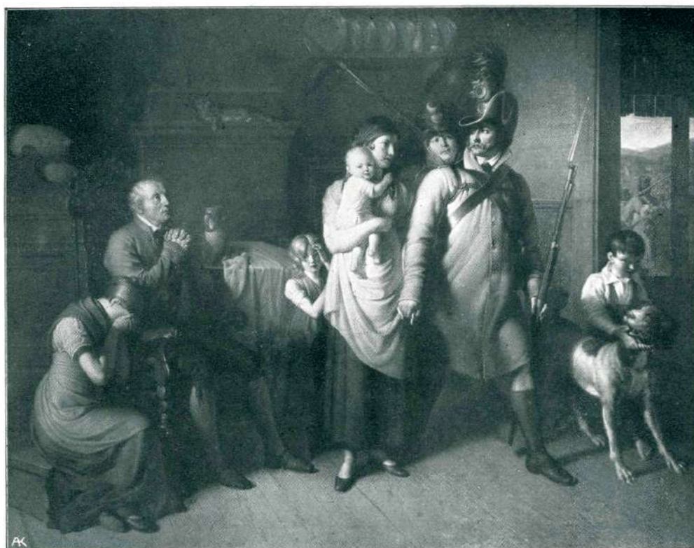
Priloga D. in Sv. št. 6.