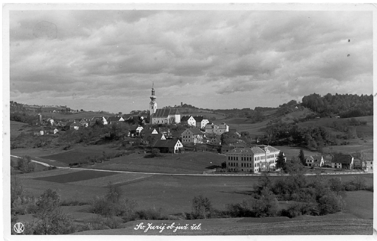
Šentjur v tridesetih letih 20. stoletja, tedaj Sveti Jurij ob južni železnici