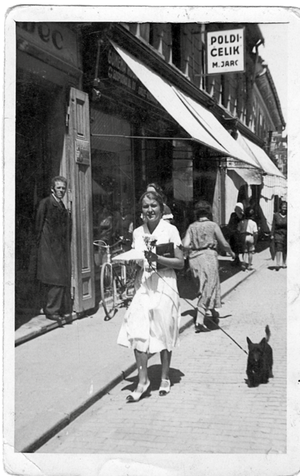
Mariborčanka na fotografiji brzoslakača, med obema vojnama