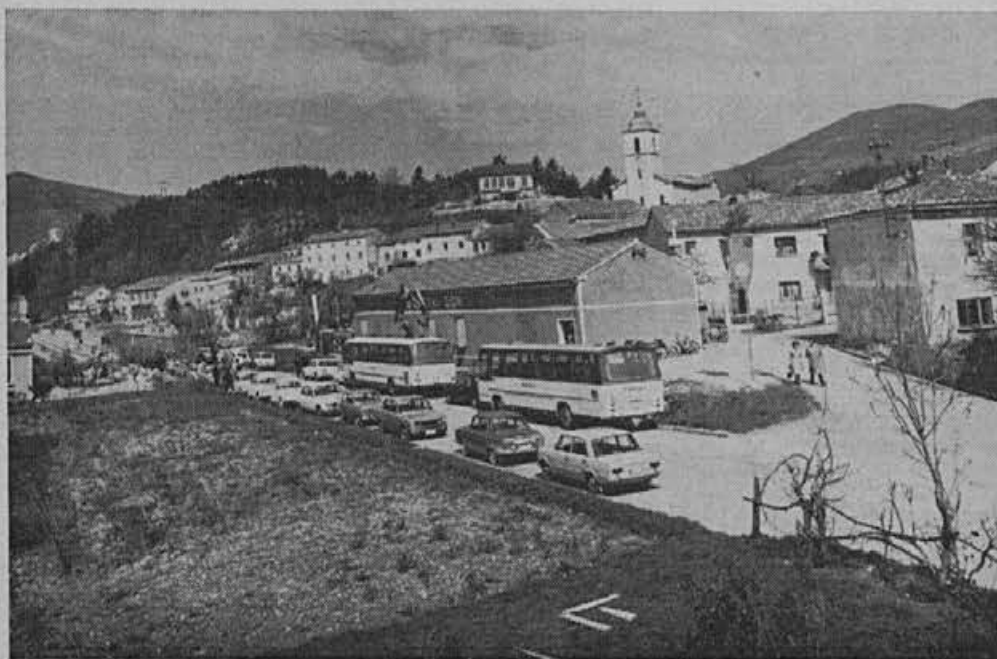
Pogled na prizorišče proslave.