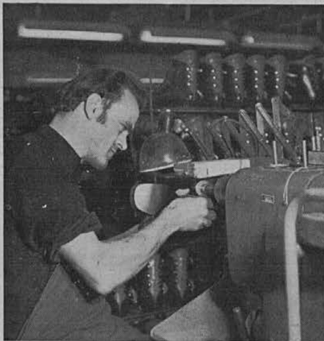
Rezkanje podplatov je kljub sodobnim strojem še vedno zelo naporna in zahtevna delovna operacija.

Izvoz je v tem obdobju potekal normalno. Natančnih podatkov ne bi navajali, ker niso primerljivi. Plan izvoza za to obdobje je izpolnjen in je odpremljene obutve nekaj več kot je bilo predvideno. Čeprav je bilo mnogo težav in negotovosti, smo vseeno lahko optimisti. Tudi za vnaprej se ne smemo bati, saj smo sposobni prilagoditi se situacijam, ki nastajajo.