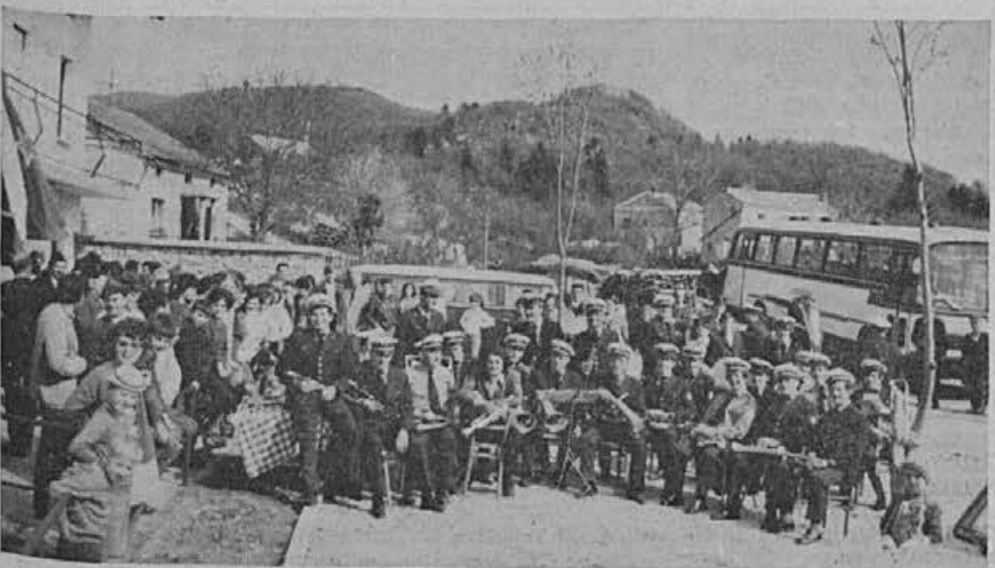
Za vedro razpoloženje je poskrbela naša godba.

membni v narodnoosvobodilni borbi in bodo spet pomembni, če se bomo kdaj morali zoperstaviti tujemu napadalcu. Zato je občinska skupščina podprla odločitev ALPINE in je tudi prevzela svoj delež pri gradnji obratne stavbe. Svoj govor je predsednik zaključil z željami za nadaljne uspehe ALPINE in pa da bi se delovni ljudje Cola čim uspešneje vključili v veliko delovno skupnost ALPINE.