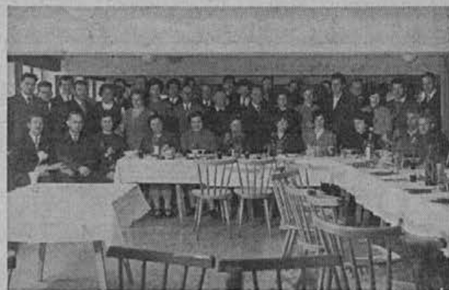
Letošnji jubilarci na zakuski.

Vsi pa prejmejo dotacijo s pogojem, da odboru za sredstva skupne porabe poročajo o svojem delu.