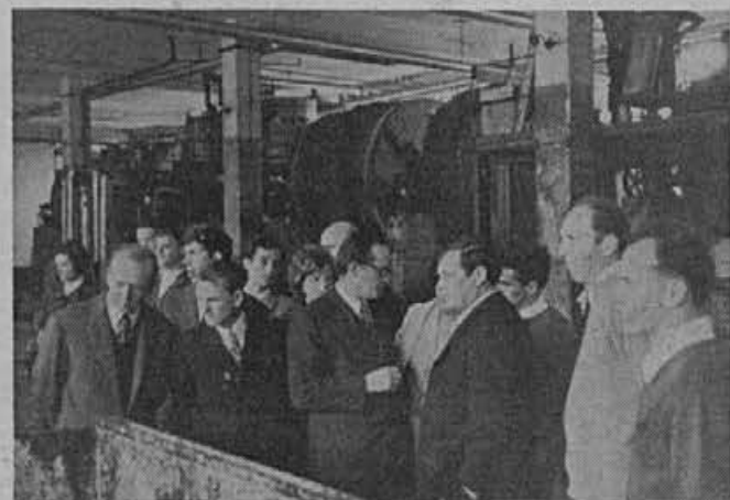
Slušatelji Tehnične čevljarske šole — oddelka v Žireh, so si v okviru strokovnega pouka ogledali tudi usnjarno — IUV — obrat Smartno.