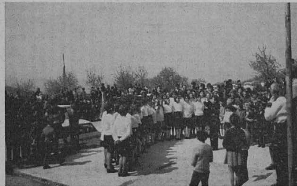
Pesem iz mladih gri je še poživila slavnostno vzdušje.