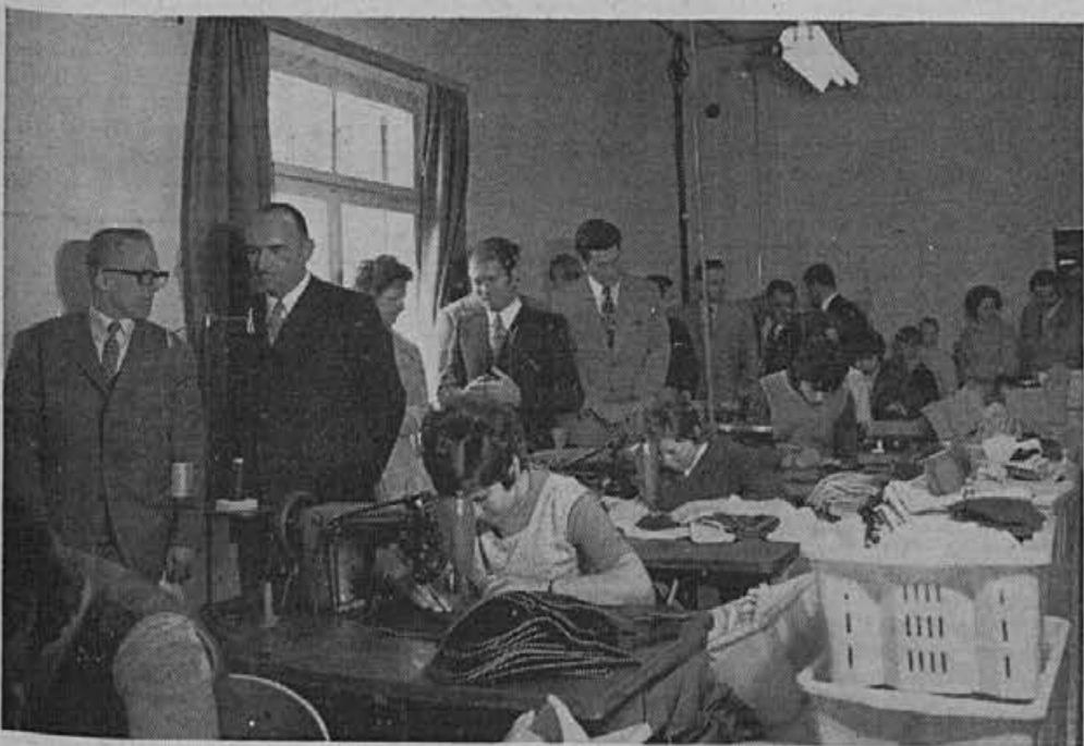
Delavnico, iz katere se bo razvil novi obrat ALPINE, si je lahko vsakdo ogledal.