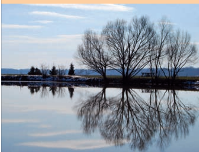
Lučka Bačič: Odsev