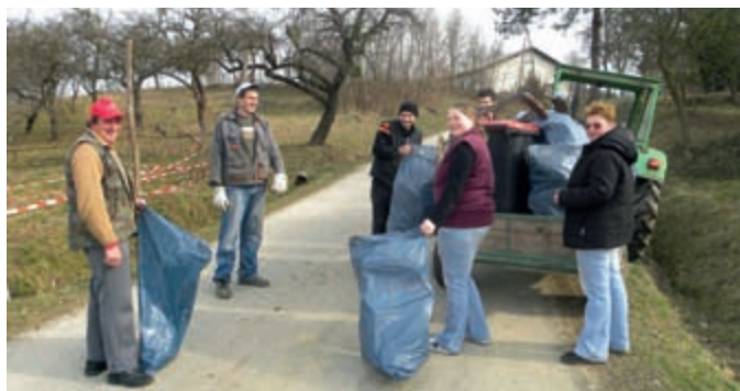
... in Ivanjševcih.

Tovorna vozila Javnega komunalnega podjetja Čista narava, ki so tudi letos odvažala v posebnih vrečah zbrane smeti na regijsko odlagalništvo za smeti, niso bila tako polna kakor prejšnja leta. Zaradi organiziranega rednega zbiranja odpadkov po gospodinjstvih, pa tudi enkrat na leto kosovnih, so veliki odpadki v naši