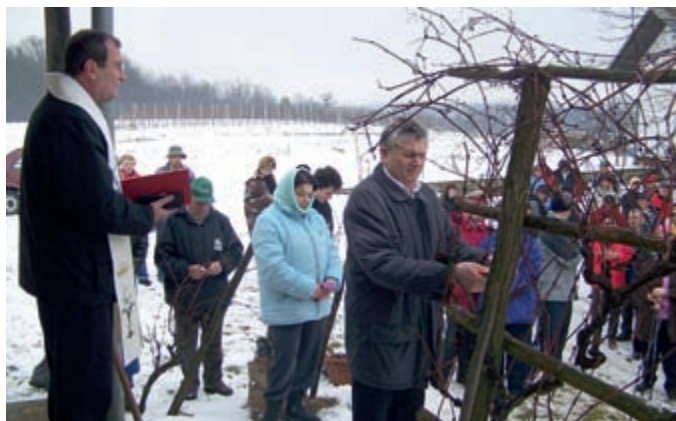
Sestavni del Blaževega pohoda je simbolična blaževa rez vinske trte.