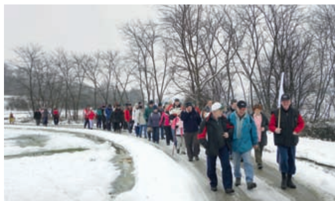
drugih opravilih koristno preživlja t. i. prosti čas. Na fotografijah: udeleženci letošnjega Pohoda po Sladki poti in januarskega pohoda v Filovcih.