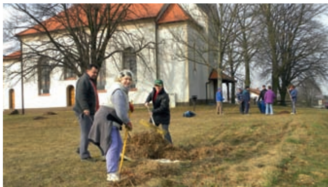
Udeleženci akcije v Selu ...

Čeprav je okolje naše občine v primerjavi z začetki pred desetletjem in več postalo veliko čistejše in s tem tudi privlačnejše za občane in obiskovalce naše občine, je bilo kljub temu potrebno pospraviti marsikatero pločevinko ali plastenko, ki se je znašla v obcestnih jarkih, dogaja pa se tudi, da se tam znajdejo tudi večje ali manjše vreče s smetmi.