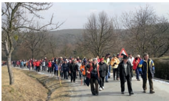
SPROŠČANJE V NARAVI – Vse več občanov se ukvarja s telesnimi aktivnostmi v naravi (tek, kolesarjenje, pohodništvo in planinarjenje, hoja s palicami ...) ter tako ob vrtnarjenju in