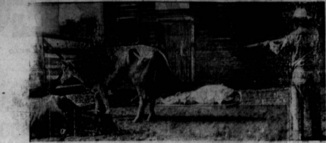
Valed suie je pridelok krme za živino katastrofalno konjujejo moko, kakor predstavlja ta dlaka iz Ojlaso smanjšan. Živina gino na pašnikih in v stajah. Obežg 32.000 glav živine je bilo v zapadni valed pomanjkanja hrane in vode. Farmarji sami ji sliškami so čerih se ta reča.