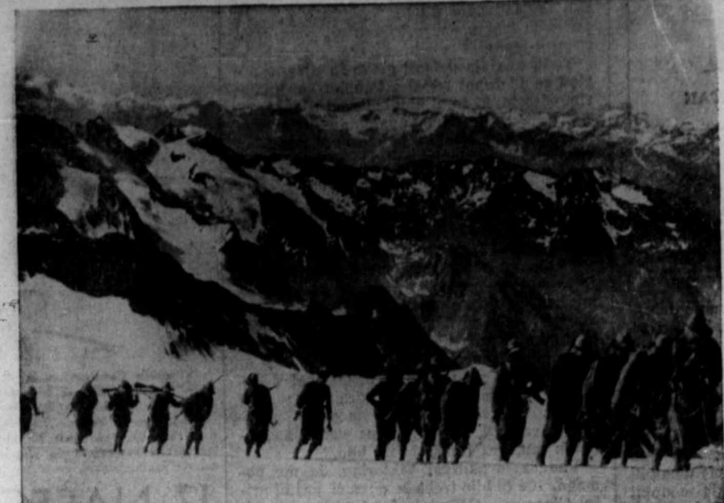
Zadnji manevri italijanske armade so se vršili ob avstrijski meji in armada se je morala vezbiti za eventualno invazijo Avstrije in za morebitni istočasni konflikt z Jugoslavijo. Na sliki so italijanski vojaki na vojnih vajah blizu koroške meje. — Konec tega leta bo imela italijanska armada nove velike manevre, ki se jih udeležijo vsi ministri.

Socialistični element je igral v rudarski uniji nekoč važno