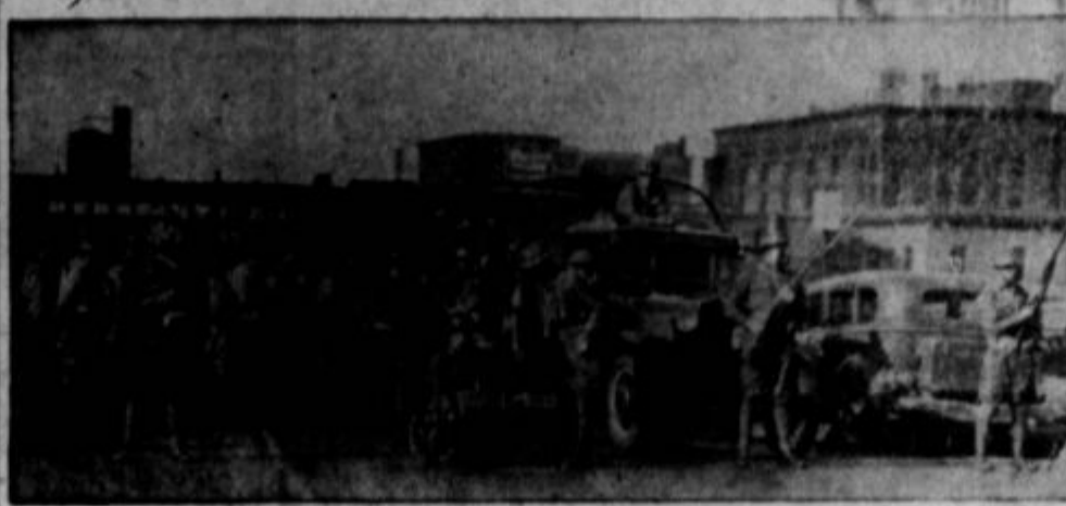
Minneapolis je dobil predzadnji teden v juliju na governerjev proglas vlado milice, ker se prevoznike firme niso pod nobenim pogojem hotele sporazumeti z delavci. Njihov namen je bil od vsega začetka stavko ugonobiti, pa naj stane kar hoče. Ko je governer Olson proglasil obsedeno stanje in izročil upravo mesta vojaštvu, so iste firme vložile priziv na zvezno sodišče proti njegovemu odloku. Slika: Vojski tabore na ulici, pripravljeni za boj proti "komurkoli".