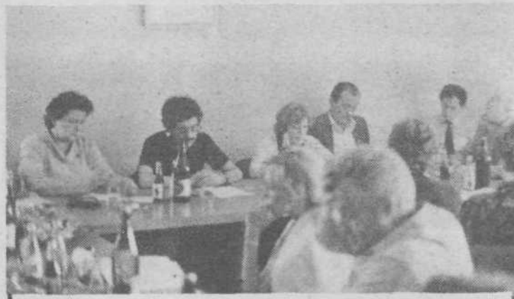
Najodgovornejši funkcionarji družbenopolitičnih organizacij in skupščine mesta Ljubljana ter širši družbenopolitični aktiv naše občine so se 31. maja sestali in izmenjali številne poglede na zastavljene naloge v srednjeročnem obdobju. Beseda je tekla predvsem o tistih problemih, ki so neposredno povezani z razvojnimi usmeritvami celotnega mesta in jih zahteva stabilizacijski čas.

S konfekcioniranjem zaves in z izdelavo zaves, ki temeljijo na našem znanju, pa bomo lahko uspešneje konkurirali tudi na zahodnih tržiščih. Vse te spremembe smo vnesli kot dopolnitve v temelje plana 1981—1985 in jih bomo v kratkem obravnavali na sestanku samoupravnih organov. JOŽE PRAPROTNIK