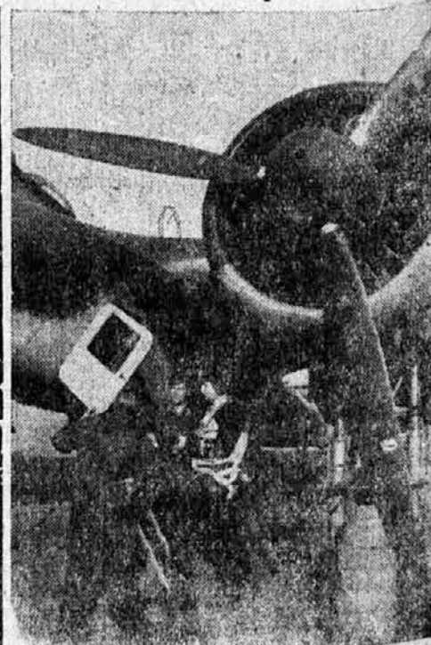
ki siplje na zemljo razdejanje in smrt