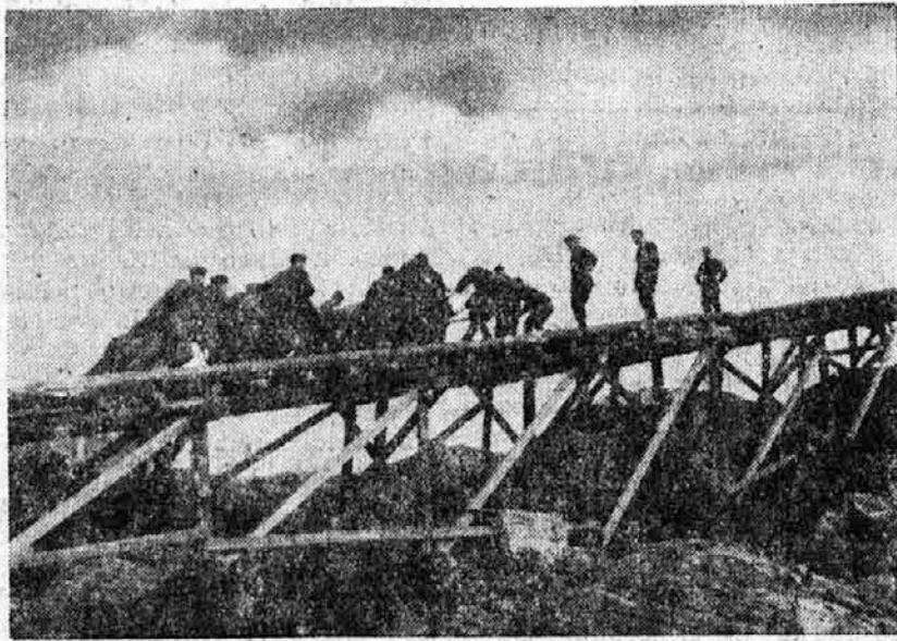
Po okupaciji Norveške so nemške čete zaposlene pri raznih gradbenih delih strateškega in prometnega značaja