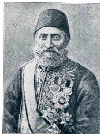
KIAMIL-PASA novi veliki vezir