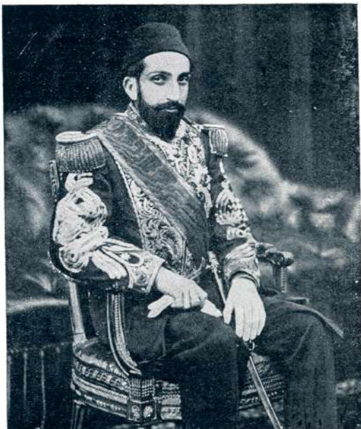
SULTAN ABDUL HAMID