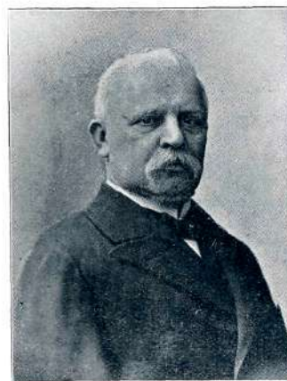
PROF. VATROSLAV JAGIĆ

Lužar. Pameten bodi, dragi moj! Jaz hočem takoj govoriti z gospodom županom zaradi komisariata. Ali greš z menoj?