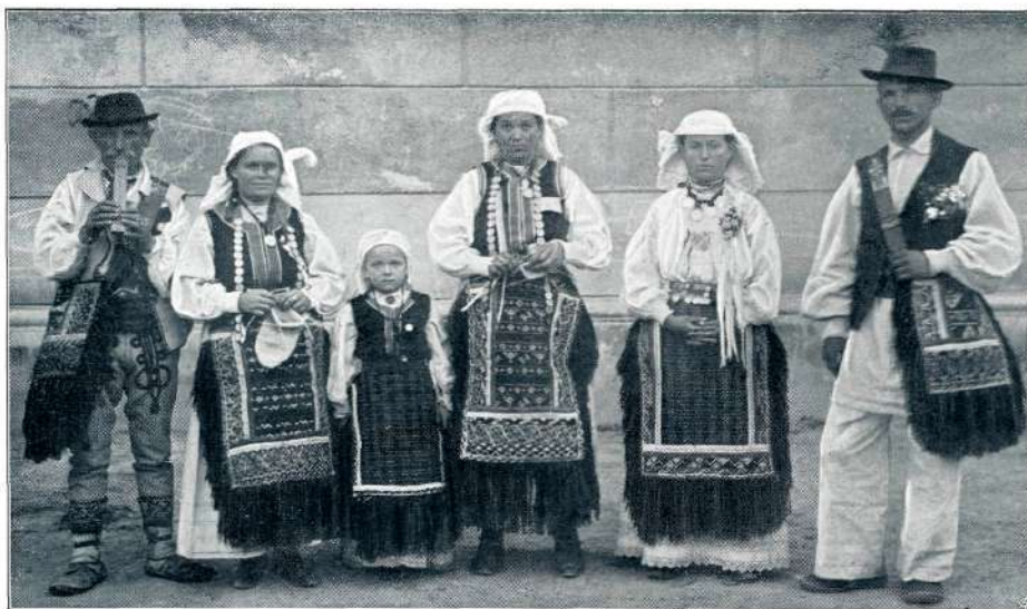
BOJANCI IN BOJANKE