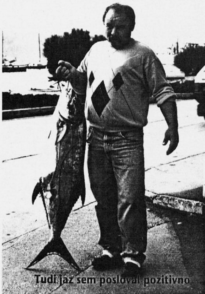
Tudi jaz sem posloval pozitivno

Na novinarski konferenci so še predstavili nov izdelek Delamarisa: tunino pašteto, ki po mnenju nekaterih prisotnih novinarjev po kvaliteti prekaša podobne izdelke iz tujine, ki se prav zdaj uveljavljajo na našem tržišču. Kdaj in v kakšni obliki (konzerva ali tuba) bo prišla na prodajne police pa še ni povsem znano, zagotovo pa ne bo trajalo prav dolgo.