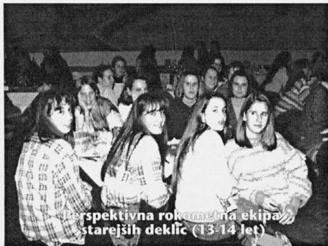
Perspektivna rokometna ekipa starejših deklic (13-14 let)