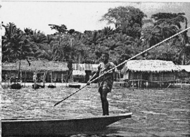
prihodnjič: Vasco da Gama

Vsekakor Diazovo ponovno odkritje skrajne afriške točke odpre prosto pot iskalcem poti v Indijo. Pomembna pa so predvsem odkritja afriške obale, ki odprejo vrata in vspodbudijo kasnejše raziskovalce in zavojevalce. Evropa s tem pridobi še eno možnost neizmernega črpanja materialnih in kulturnih dobrin. Svet po odkritju Amerike in morske poti v Indijo postane bolj trgovsko povezan. Vendar pa so postavljeni tudi temelji za nečloveške odnose, predvsem s strani bele rase. Začne se obdobje trgovine s sužnji.