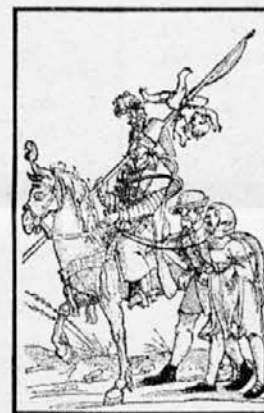
Turški jezdec z nabodenim otrokom in plenom (letak)

Iz Turkestana so do sredje 13. stoletja zavzeli skoro celo Malo Azijo. Leta 1352 so Turki (Otomani ali Osmani) prvič stopili na evropska tla. V naslednjih desetletjih so zavzeli Bolgarijo in prodrli prav do Albanije in Srbije. Na Vidov dan leta 1389 so na Kosovem premagali srbsko vojsko, v naslednjem stoletju pa zasedli vso Srbijo in