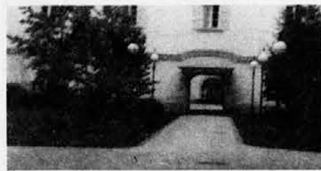
Vetrinjski grad ali samostan, kjer so se zbirali begunci k maši in kjer je bil tudi otroški vrtec.

Hodili cel dan in celo noč. Prišli ob 6h v Tržič na Ljubelj. To je bilo že 10.5.45. Pod Ljubeljem stali 7 ur; potem smo ga prekorčili, hodili po koroških tleh. Prvič po 10. letih se je spet slišala slovenska pesem. Potem v Podljubelj in St. Rožco. Tu smo se udarili s partizani, ki so stražili nad prehodom, čez Dravo so se umaknili, uničili dva tanka in tri partizane.