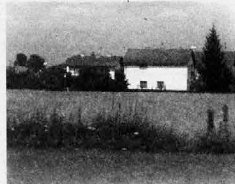
Ostanki nekdanjega prostranega polja, kjer je stalo taborišče.