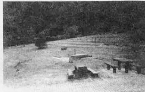
Ostanki nemškega taborišča pod Ljubeljem, v katerem so bili francoski ujetniki-kopači v ljubeljskem predoru.

9.5.45. Domov sem šel in se poslovil od vseh, brat je prišel domov. Ob 10. zvečer smo šli iz Ljubljane - Šentvid - Šmartno - Vodice.