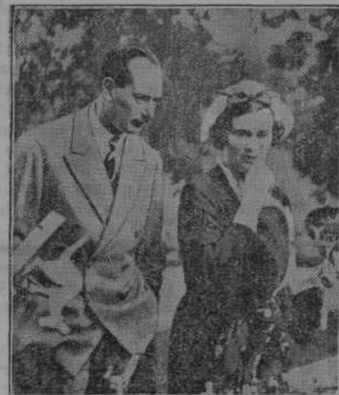
Tretji sin angleškega kralja se je zaročil s hčerko znamenitega angleškega vojvode. Zaročenki je ime Alice.

„JUGEFA“ K. D. Zagreb, Preradovičeva ul. 16 Oddelek za zaščito rastlin