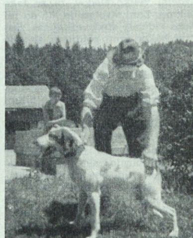
Pri vaji: »sedi!«

tekmovalo pa jih je 26. Od teh je bilo 13 kratkodlakih istrskih goničev, en resavec, dva balkan-