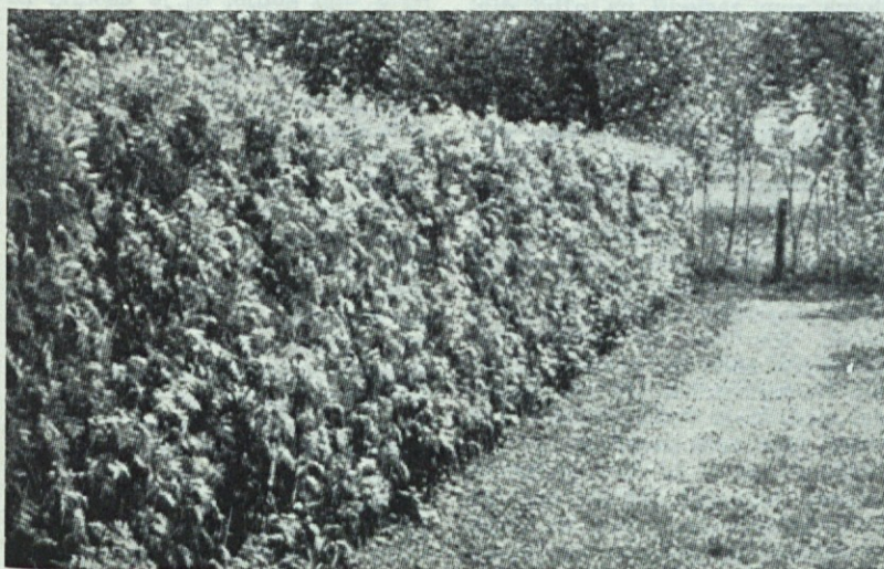
Mrežasta živa meja iz jerebike