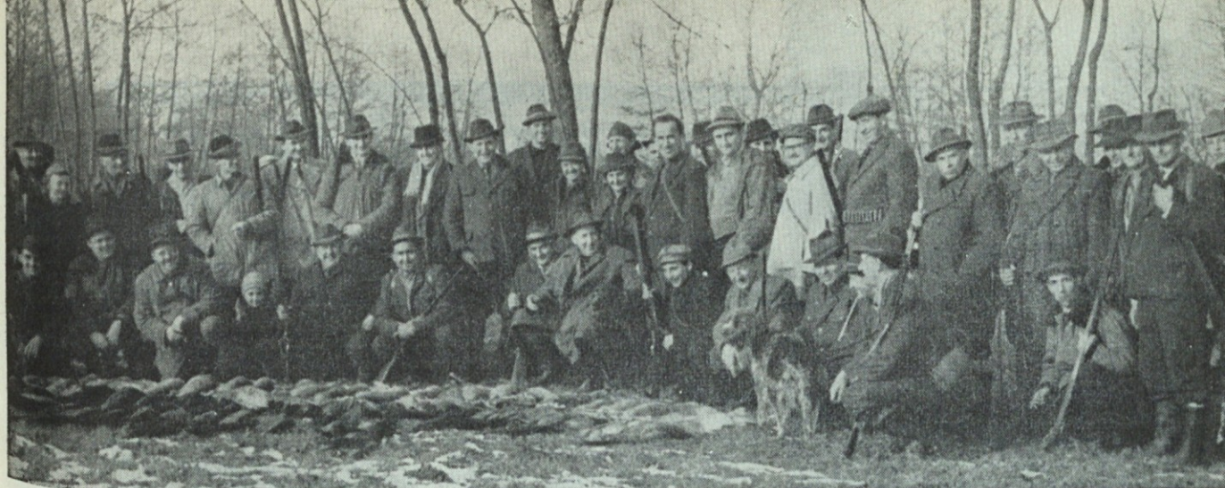
Lovci z lovino v lovišču LD Ljutomer, 10. dec. 1961