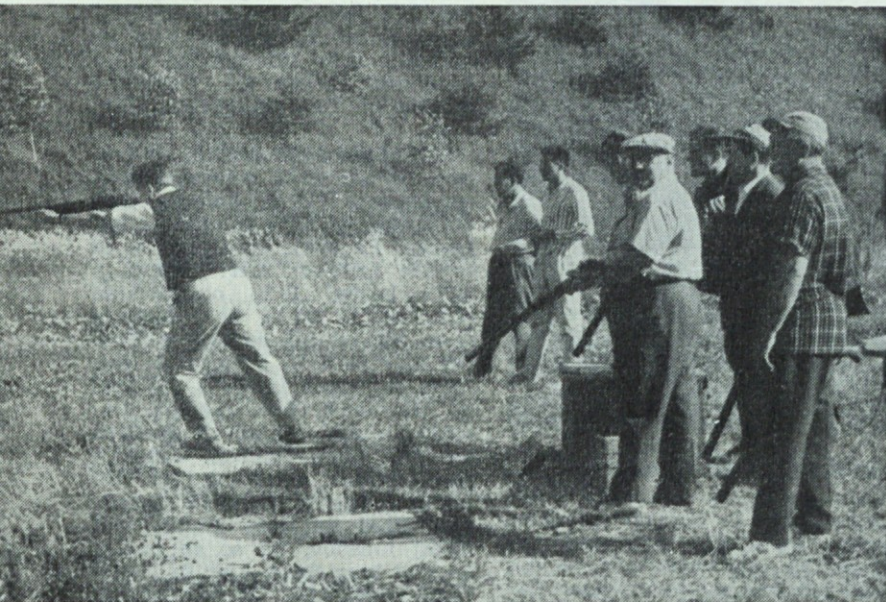
Strelec Jež... »pul«