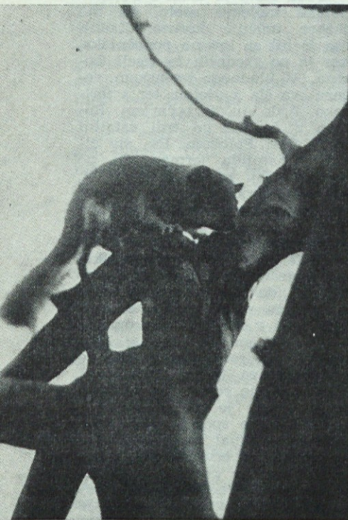
Polh gre spat

V mladih letih sem imel mnogo več priložnosti, da sem s puško nadzoroval lovišče. Lepo nedeljsko popoldne sem pregle-