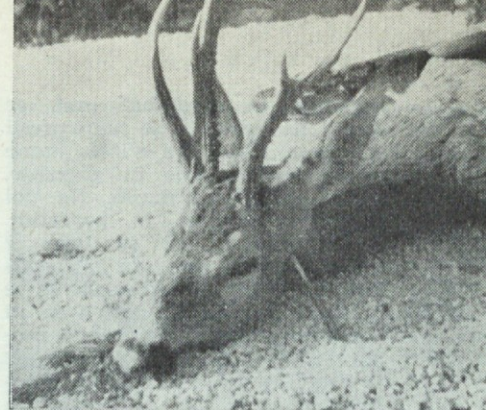
Izredno rogovje srnjaka s tremi stebli — 106 točk — uplenjen v prsku na Pokljuki 1962. Uplenitelj Viktor Avbelj

Pri tem sva pridobila dobro skušnjo. Leto za letom namreč strupimo vrane in srake po poljih. Napravljamo primitivna gnezda, kamor polagamo po 2 do 3 jajca. Brez dvoma, da je ta način strupljenja uspešen, toda truda je precej. Pri tem načinu