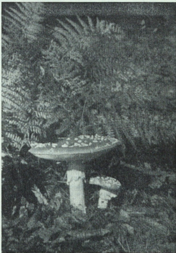
»Zadnje strupenjače«