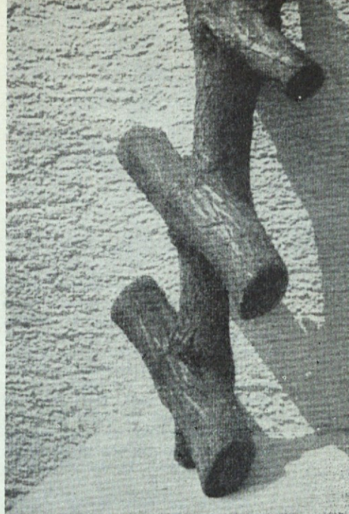
Izrezek štiriletne mrežaste žive meje iz robinije

belca se zaradi stalnega stika sama med seboj zarastejo in tako nastane prožna živa mreža, ki je od leta do leta gostejša in kot ograda ne samo za ograje in zaradi trdnosti za varnostne ograje ob cestah, temveč tudi kot obramba proti vetru in zametom, za varovanje bregov, nasipov itd.