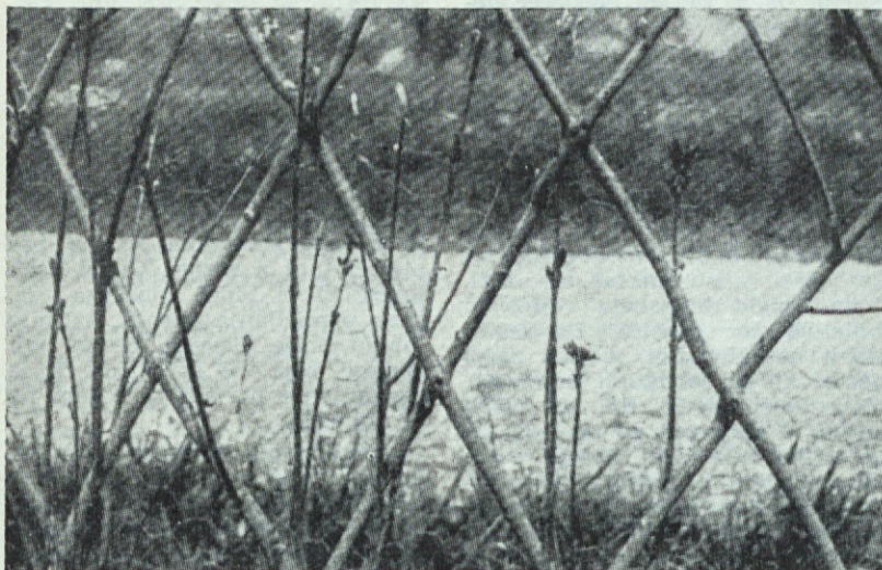
Zarasila križanja mrežaste žive meje

povsod drugod uspešno nado-meščajo ograde in plotove iz mrtvega materiala. Mrežaste žive meje imajo predvsem prednost, da jih ni treba obnavljati in žive toliko časa, kolikor je življenska doba drevja, iz katerega je meja. Ko se ta mreža živih debelc med seboj zaraste in preplete, je meja tako gosta, da niti manjše živali ne morejo skozi. Posamezna debela, kakor je to pri navadnih živih mejah, pa ne morejo odmrreti, ker so vsa debelca medsebojno organsko zvezana zraščena kot eno samo drevo. Uporabljivo je tako listnato kakor iglasto drevje. V primernem razstoju posadimo vitka debelca, ki jih prekrizamo in na stičnih mestih spnemo s kovinskimi sponkami. Pri tem ne potrebujemo nikakega orodja, ker debelc nič ne zarezujemo ali gulimo. De-