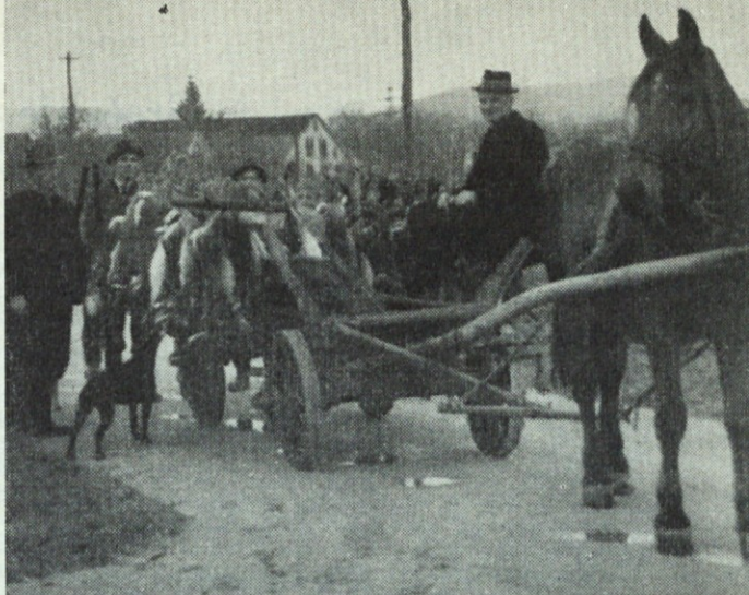
Obilna lovina LD Polzela — 1960

Za sigurno uplenitev zelo močne divjadi je pa potrebna zadostna masa izstrelka (globinski učinek) in dovolj velik premer kalibra (velikost strelnega kanala) in torej ne zgolj največja mogoča zadetna moč. Zato kal. 7 × 64 (R) tudi z najmočnejšim nabojem, ni brez pridržka uporabljiv za zelo močno divjad (los, grizli, vapiti, sev. jelen) zlasti ne na večje razdalje. Univerzalnost tega kalibra je torej nasproti preostalin kalibrskima skupinama manjša.