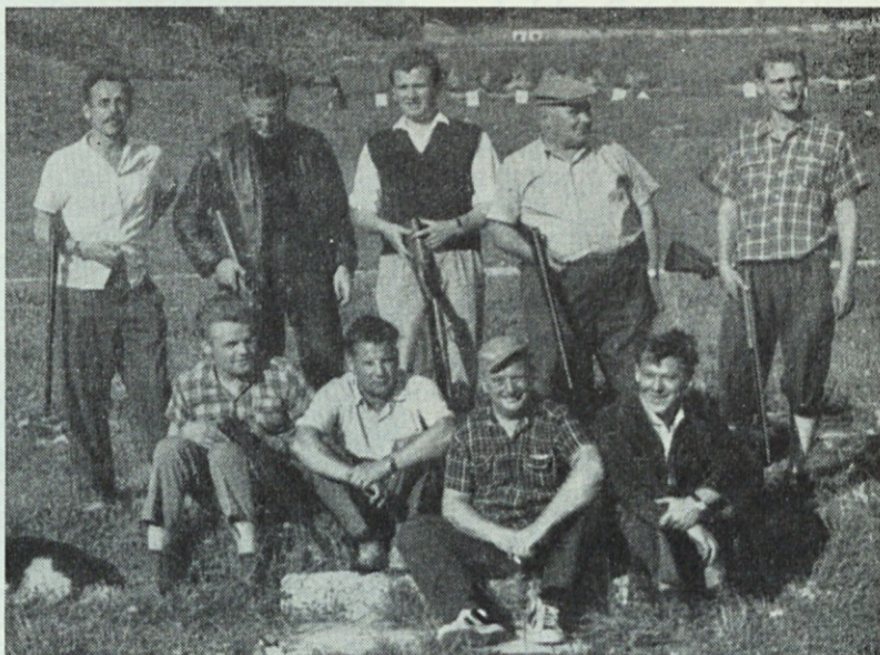
Zmagovalci okrajnega strelskega prvenstva

Ta lepi šport se zadnja leta pri nas razveseljivo razvija in je že precej lovskih družin, ki so