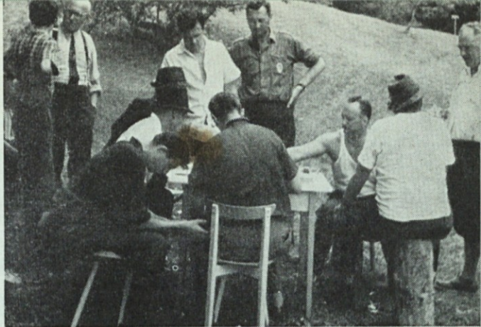
Komisija pri delu

jaško puško, malokalibrsko puško in z zračno puško. Tekmovanje je bilo po zaslugi organizatorja odlično pripravljeno in je brezhibno potekalo. Tokrat je družina vzela tekmovanje zelo resno in zato je bilo doseženih nekaj odličnih rezultatov: