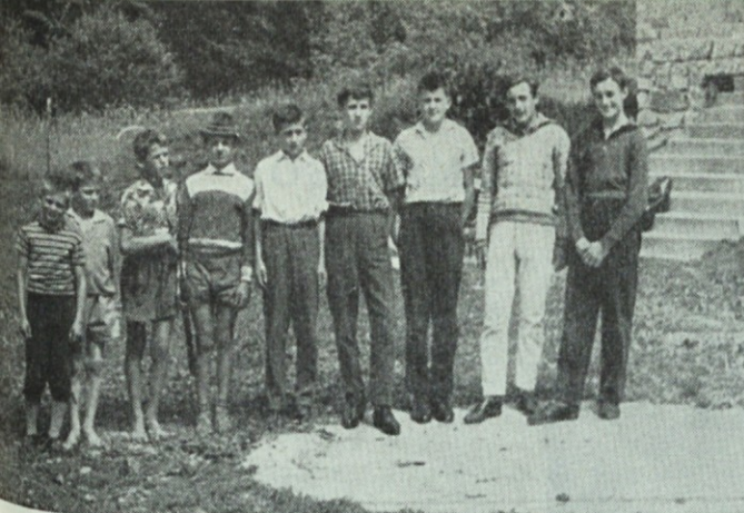
Mladinski aktiv LD Vojnik