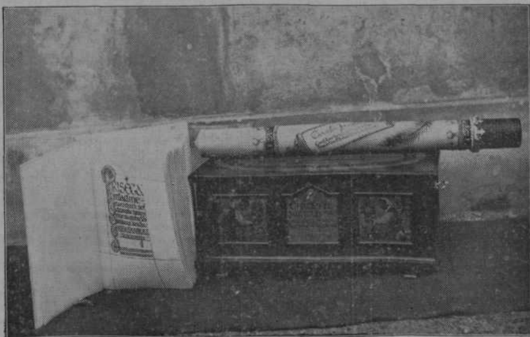
Skrinja v kateri bodo hranjene knjige pergamentov. Poleg skrinje leži sveča, ki bo prižgana v imenu 180.000 otrok.