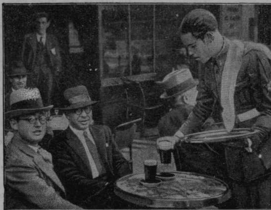
Dne 1. maja so stavkali v španskem mestu Barcelona natakari, katere je hitro nadomestilo vojaštvo.