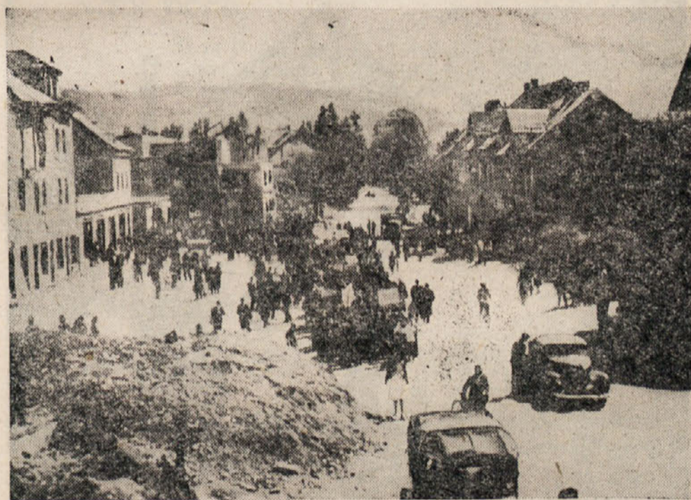
15. aprila 1946

se je tisoče koroških Slovencev, med njimi deloma vsi izseljenci, zbralo v Celovcu na proslavi obletnice zločinske izselitve, na proslavi žrtev nacističnega nasilja nad koroškimi Slovenci.