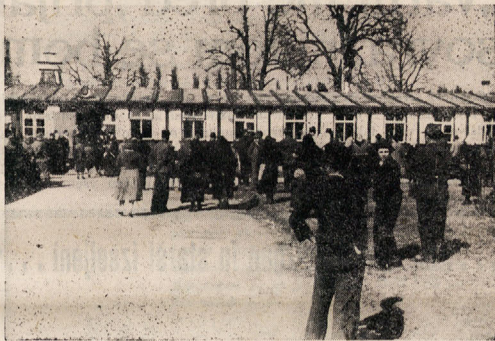
14. in 15. aprila 1942