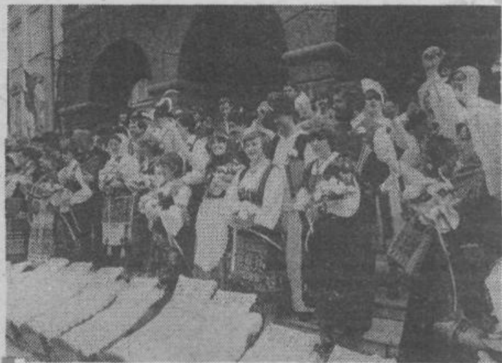
Predpočitniška prireditev v Ljubljani: Kmečka ohcet '81