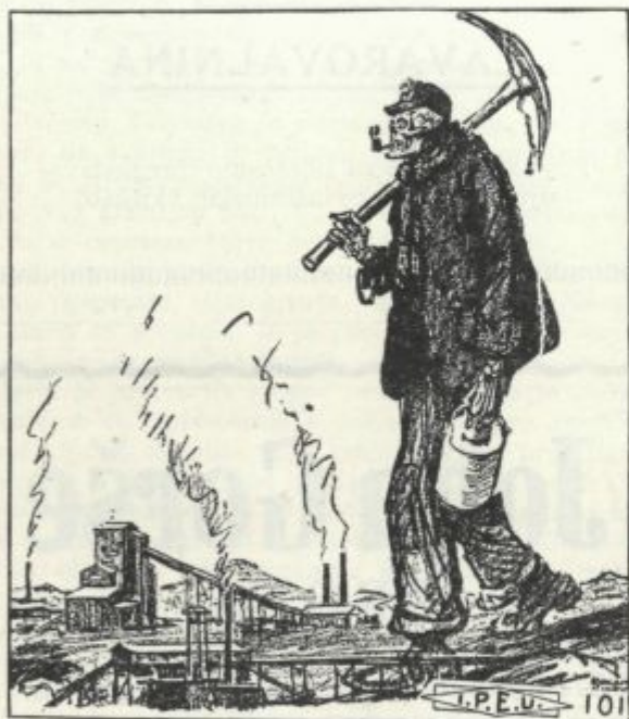
Rudar, kakršnega bi ne bilo treba.

Prvi maj je praznik DELA. To je NAŠ dan! Zavedno delavstvo po vsem svetu se bo tudi letos zbiralo skupaj, pregledalo svoje poljane, se ozrlo na svoje padle tovariše, potem pa zopet NAPREJ!