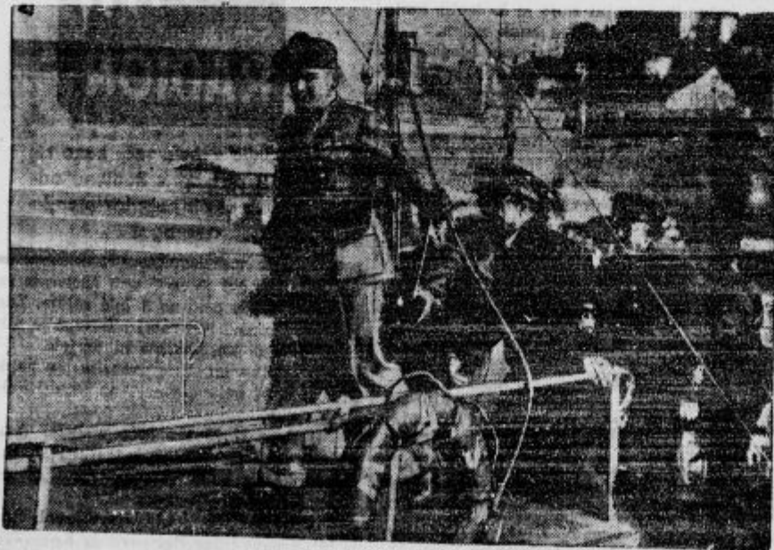
Mussolini, gospodar Italije, je te dni obiskal veliko italijansko kolonijo Libijo v Afriki. Potoval je na vojni ladji in je gredoč nadziral tudi vaje italijanske mornarice. Na sliki vidimo četa italijanske vlade, ko prihaja na vojno ladjo »Pola«.

pridite, da Vam jih s koreninico in brez bolečin odstranimo. Takoj Vam bo odleglo. Zopet boste prijetno razpoloženi za vsako delo. Sprejemne ure ob delavnikih od 7.30 do 18.30 ob nedeljah od 7.30 do 12 ure, v kopališču hotela Slon — Franciškanska ulica 3.