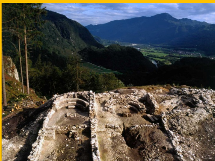
Slika 1: Tonovcov grad med izkopavanjem.

Ljubljana: Inštitut za arheologijo ZRC SAZU, Založba ZRC, 2011. 304 str., ilustr. ISBN 978-961-254-331-0. [COBISS.SI-ID 258819584 ]