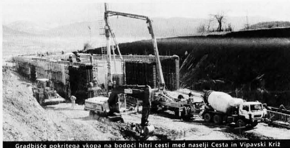
Gradbišče pokritega vkopa na bodoči hitri cesti med naselji Cesta in Vipavski križ

Družba Primorje izvaja veliko gradenj, od teh kar okoli 70 odstotkov na področju nizkih gradenj. Pri tem bodo zgradili kar četrtno novih avtocest (na Primorskem hitrih cest), ki jih načrtujejo v Sloveniji v okviru posebnega programa. Vseh gradenj in drugih dejavnosti, ki jih izvajajo, seveda ni moč naštetih in podrobneje obrazložiti. Kot omenjeno, je posebno pomemben avtocestni program, tudi tisti del, ki se nanaša na razširitev in modernizacijo ustroja t.i. hitrih cest na Primorskem, v smereh proti Novi Gorici in proti Kopru oz. proti Slovenski Istri. Med deli, ki jih izvaja ajdovska Družba Primorje, omenjamo nadalje modernizacijo in razširitev hidroelektrarn Plave II. in Dobar II., gradnjo raznih objektov v Luki Koper, pred kratkim pa so podpisali tudi pogodbo za zgraditev 2,5 km dolge železniške proge Hodoš-mad-