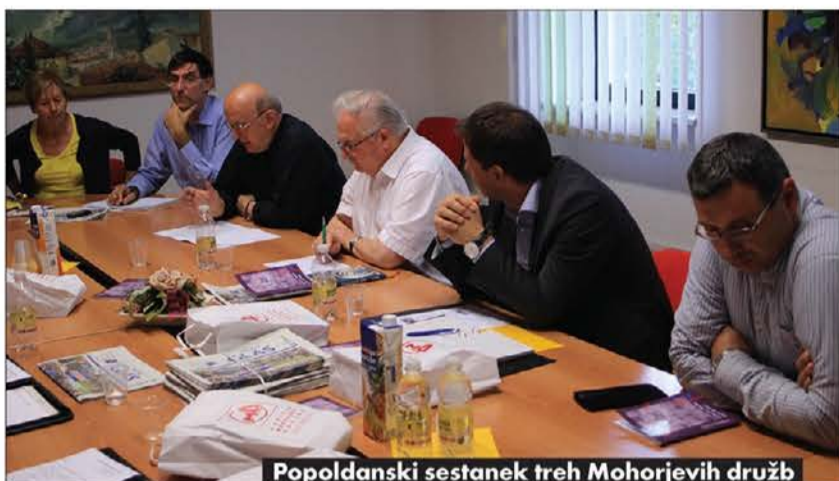
Popoldanski sestanek treh Mohorjevim družb

a tega se zavedamo. Knjiga je zakrament, ključki in elektronski bralniki je ne dosegajo. Tiskana knjiga, ki jo lahko položimo na polico, bo mnogim potrkala na vest". Predsednik Celovške Mohorjeve družbe je najprej orisal kratko zgodovino institucije, ki jo vodi, in se nato zaustavil pri zdajšnji dejavnosti, ki presega samo založniško dejavnost: "Pred 25 leti smo pomagali postavljati temelje dvojezične šole v Celovcu. Takrat se je to zdelo neizvedljivo, danes pa je šola zelo dobro integrirana v okolje. Tudi Celovška Mohorjeva družba uživa vse večji ugled pri celotni koroški populaciji: odločila se je, da bo izdajala