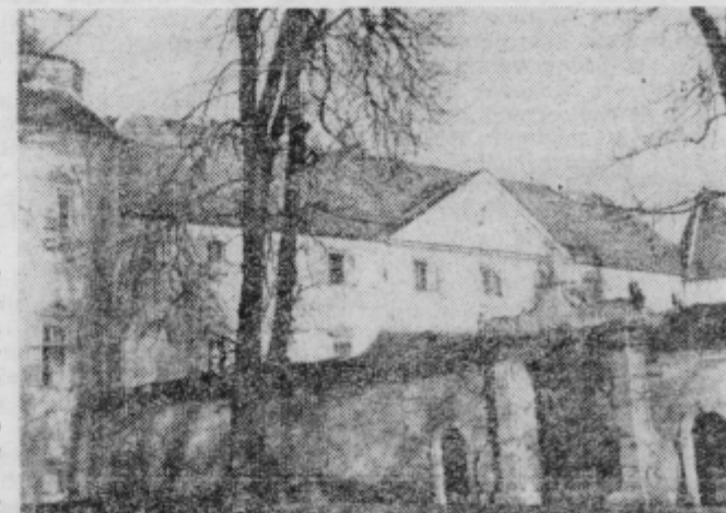
Uredništvo Pogled na del gradu z vhodom