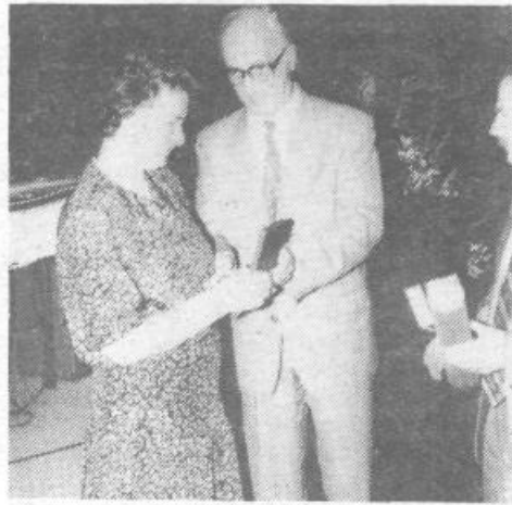
Na slavnostni akademiji so med drugim podelili tudi več priznanj

Pa se je kramljanje mladega omizja na odru o Zavodu na lepem prevelo v pravo skeč, kjer so po vrsti vznikli »šahovski mojstri« (za pravo šahovnico) »košarkaš« z žogo, nekdo je