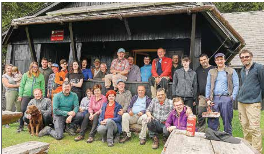
Na Travniku so člani društva izvedli delovno akcijo, v kateri so pripravili drva in kočjo za sezono.