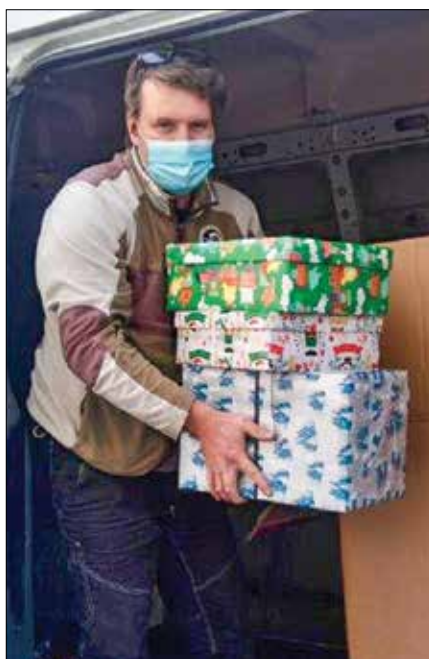
V Medgen borzi na Rečici ob Savinji so zbrali več kot 80 daril za otroke in starostnike.

VIRTUALNA RAZSTAVA ŠTIRJE LETNI ČASI – JESEN