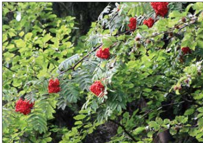
Rdeče plodove jerebike so nekoč uporabljali kot vabo za ptice.

Zaradi rdečih plodov, belih cvetov, zanimive skorje, nizke rasti, ozke krošnje z malo listja, medovitosti in svetloljubnosti postaja jerebika vse bolj priljubljeno okrasno drevo v urbanem okolju.