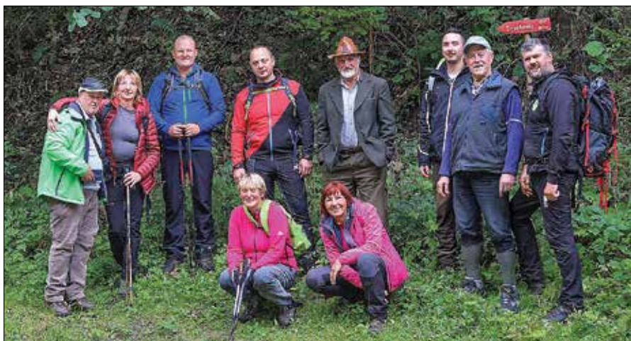
Zadnji letošnji pohod je bil ob Dnevu Smrekovca.

Konec junija so izvedli pohod na Uršljo goro. Začetek poti je bil na Slemenu, nato po gozdni