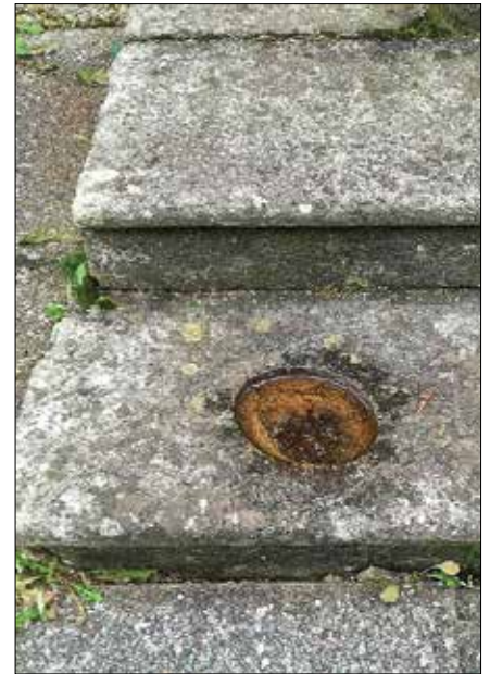
Skrivnostna vdolbina v stopnici pred glavnim vhodom v kokarsko cerkev

1868 je neznan dobrotnik daroval nove slike križevega pota, namesto majhne lesene cerkvene kajže pa je bila sezidana prostorna mežnarija.