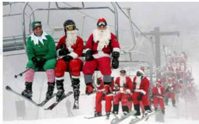
A to so vsi člani istega gospodinjstva?

Lopov: "Od slej kradem samo še telefone z naloženo aplikacijo #OstaniZdrav za prehod občinskih mej. Pravzaprav sem že začel. Prvi telefon že imam."