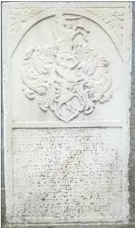
Nagrobnik grofice Eve Zofije von Dietrichstein, umrle leta 1612

Leta 1612 je bila tu na pokopališču pokopana gospa Eva Zofija von Dietrichstein, rojena von Gallenstein. Njen nagrobnik je vzdan na severni zunanji cerkveni steni in napis na njem pra-