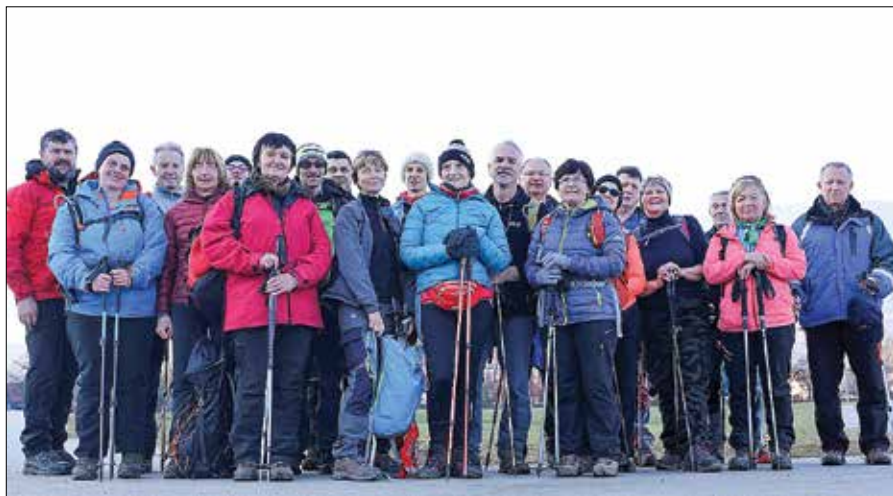
Utrinek s pohoda z Lipe na Čreto do Mozirja

Februarja so se podali na Košutnico ali Ljubeljsko babo. Pot so začeli na mejnem prehodu Ljubelj, nadaljevali po cesti do starega mejnega prehoda Ljubelj in naprej na vrh Košutnice – Ljubeljske babe. Vračali so se preko planine Korošice. Društvene aktivnosti so bile po koncu februarja prekinjene zaradi prvega vala novega koronavirusa.