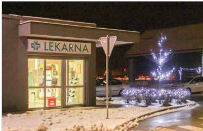
Vnos okužbe v lekarnе v manjših krajih pomeni, da lahko ljudje čez noč ostanejo brez zdravil v svoji občini.

V nedeljo je bilo na območju Slovenije 25,7 odstotka testov pozitivnih. Testirali so 1679 oseb, 431 je bilo pozitivnih. Umrlo je 44 bolnikov s