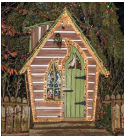
Utrinek iz Začarane vasi

Pred objektiv se je v Mozirju postavil le parkelj Lucifer.