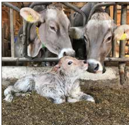
Pri Tonku redijo 45 krav molznic in 45 plemenskih telic.

Neža je že kot študentka domače izdelke vključevala na fakulteti za potrebe šolskih analiz. Profesorji so bili navdušeni nad njihovo izredno kvaliteto. Tako so njihove jogurte vključi-