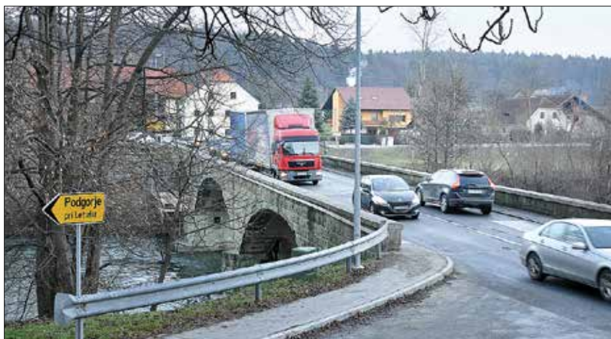
Most v Letušu bo med obnovo zaprt za ves promet.