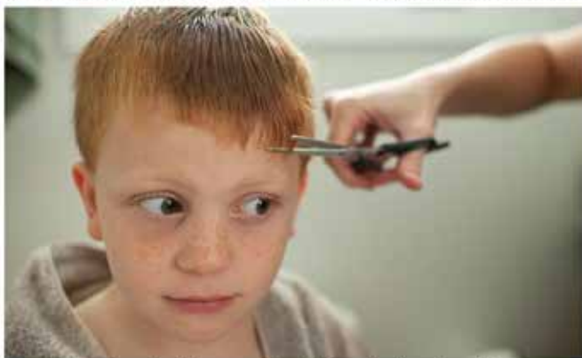
Mami, saj zdaj so pa frizerji že odprli svoje salone.

Rečičanka: "S tem pa se jaz sploh ne strinjam, saj menim, da imaš prav samo v točki, ko je treba poslušati samo enega izmed njih, a samo do točke, dokler si ne začne nasprotovati."