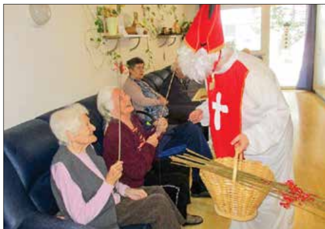
Drobnih pozornosti so v DEOS Centru starejših Gornji Grad deležni tako stanovalci kot zaposleni.

Različna podjetja se odločajo, da jih presenetijo z izdelki za podporo imunskega sistema. Med drugimi sta stanovalce in zaposlene centra presenetila Sensilab in družinsko podjetje Nadlučnik iz Radmirja. Podjetje Sensilab je zaposlenim in stanovalcem podari-