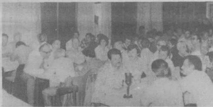
Tudi po tekmovanju so borci in mladi sedli skupaj k tovariškemu pomenku.