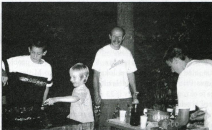
Del ekipe, ki je poskrbela za pogostitev pevcev in godcev

Seznam razstavljalok (nekatero vezenin delajo same, druge so prispevale izdelke, ki so jih dobile od svojih mam, starih mam ali drugih sorodnic):