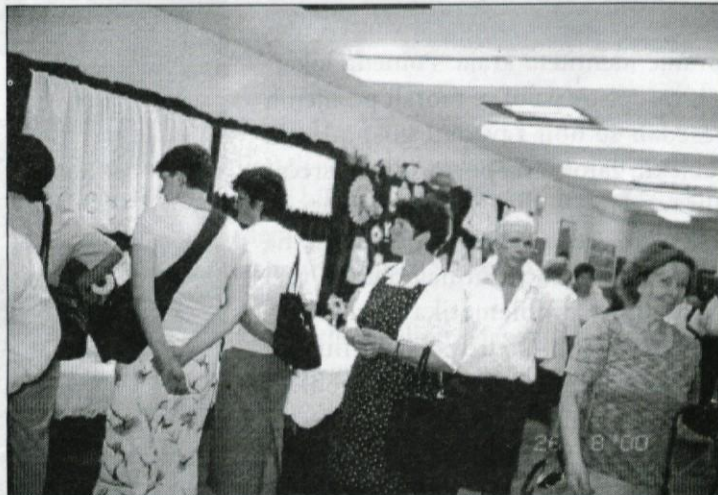
Razstava je vzbudila veliko zanimanja