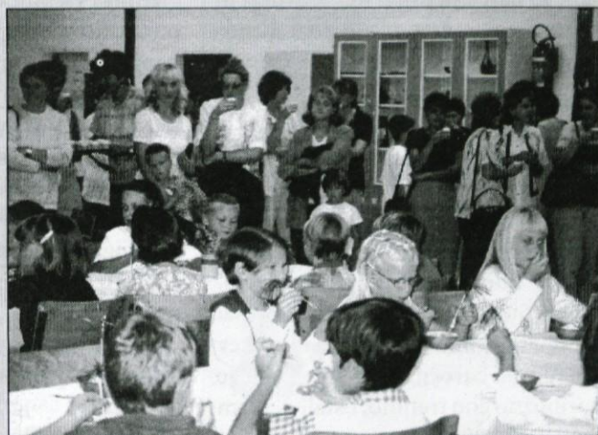
Prvošolčki s svojimi starši