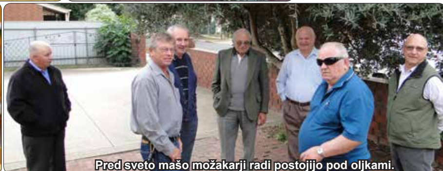
Pred sveto mašo možakarji radi postojijo pod oljkami.