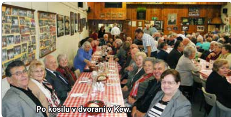
Po kosilu v dvorani v Kew.