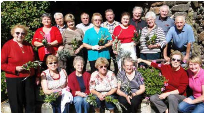
V soboto pred cvetno nedeljo, 12.04.2014, v Kew, ko smo pletli butarice, pripravili oljčne vejice ter uredili okolico Baragovega doma in cerkve.

LETOŠNJI 40. SLOVENSKI MLADINSKI KONCERT bo v dvorani Slovenskega misijona v Kew v soboto, 4. oktobra 2014, ob 3. uri popoldne. Vabimo zainteresirane, da se čim prej prijavite. Prijavnice dobite v vseh naših misijonih ter na Stičišču avstralskih Slovencev ( http://www.glasslovenije.com.au/ ).