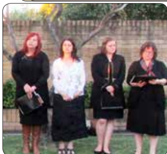
Program za so začele pevke zbora Južne zvezde s petjem avstralske in slovenske himne.