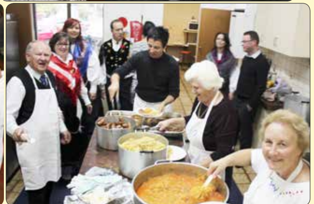
Kuharska ekipa, ki je pripravila večerjo.