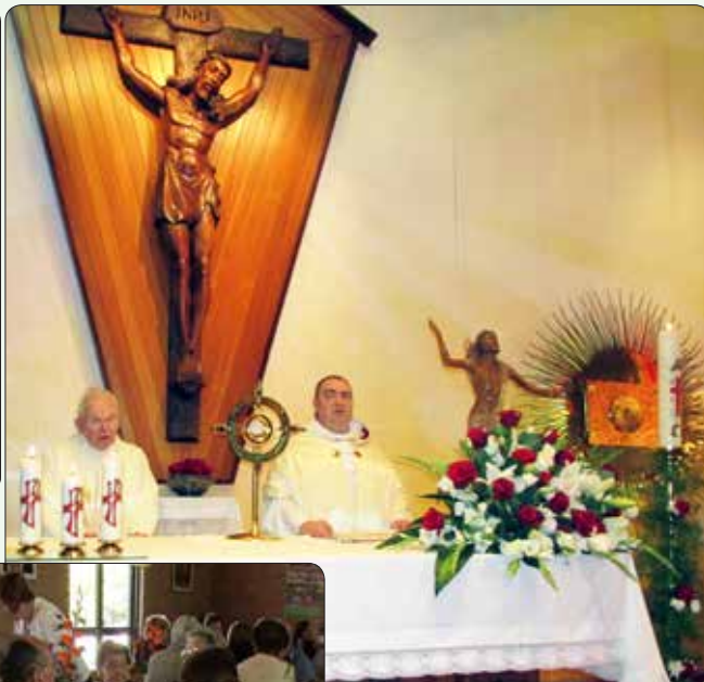
Pokleknili smo pred lepo okrašenimi oltar in zapeli Aleluja, Gospod je vstal.