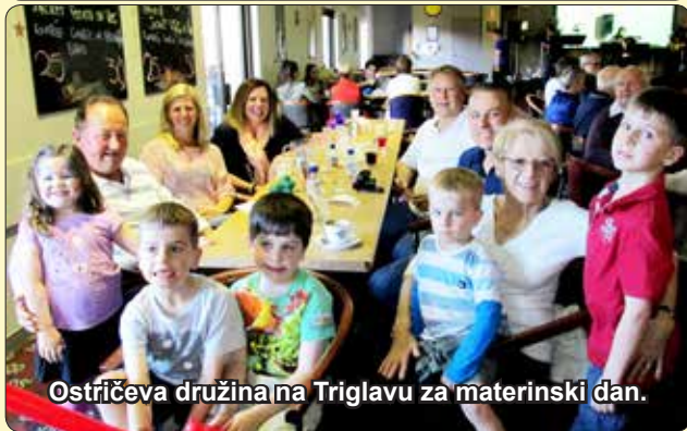
Ostričeva družina na Triglavu za materinski dan.