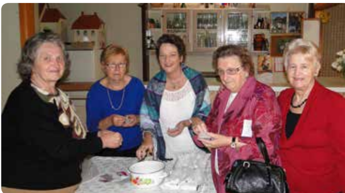
V nedeljo, 25. maja 2014, so naše pridne gospodinjice s sodelavkami in sodelavci pripravili BBQ kosilo. Bog jim vsem povrni! Prijetno je druženje v dvoranci, še posebej sedaj, ko se ne srečujemo več vsako nedeljo, in dobro ter okusno kosilo – s prihodki od takšnih prireditev pa pomagamo kriti finančne stroške cerkve in naših dejavnosti.

poznamo, saj smo ga mnogi tudi srečali ob njegovih obiskih v Avstraliji in tudi v Sloveniji. Slika obeh papežev pred oltarjem nas je združila z dogajanjem v Vatikanu, kjer se je več sto tisoč ljudi udeležilo slovesnosti na trgu sv. Petra, kar smo lahko spremljali tudi popoldne na televiziji.