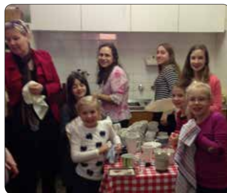
Otroci Slomškove šole so pomagali mamicam pri pripravi kave in čaja na cvetno nedeljo v Kew.