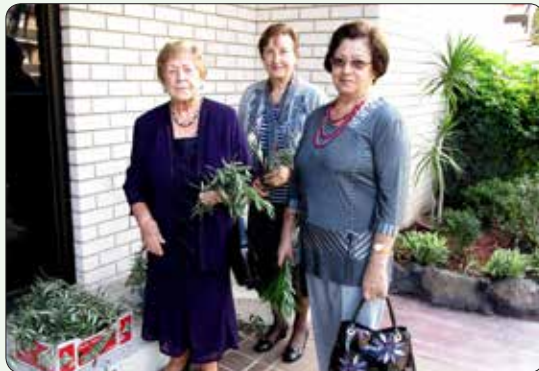
Vernice si izbirajo oljčne vejice za blagoslov.