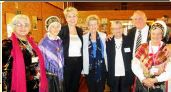
Še posebno smo bili veseli Tanye Plibersek MP, namestnice vodje zvezne opozicije.

V dvorani Verskega središča v Merrylandsu je HASA NSW pripravila proslavo desete obletnice slovenskih arhivov in deseto obletnico vstopa Republike Slovenije v Evropsko Unijo. Hkrati smo praznovali tudi obletnice prihoda v Avstralijo vseh tistih Slovenskih rojakov, ki že deset let ali več bivajo v tej naši novi domovini.