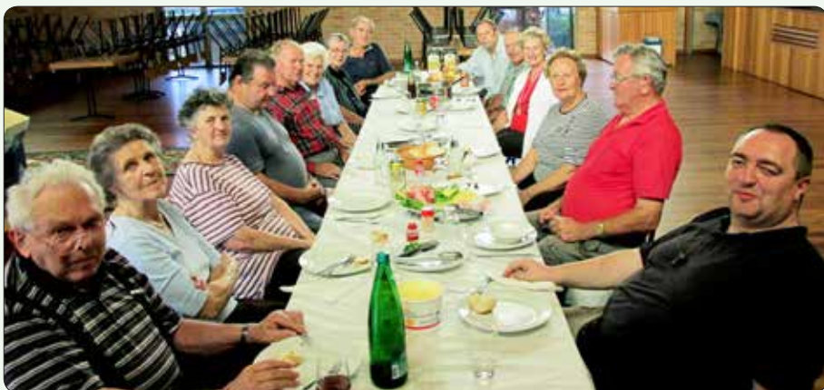
Prostovoljci po končanem delu v Merrylandsu.