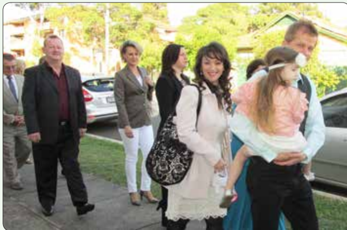
Tudi druga in tretja generacija Slovencev se nam je pridružila pri velikonočni procesiji v Merrylandsu.