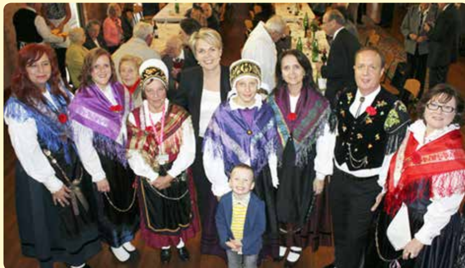
Južne zvezde in Tanya Pliberšek.