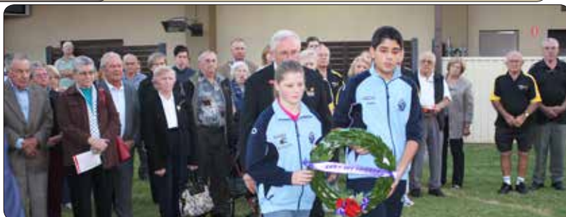
Mladinci polagajo venec pred spomenik slovenskemu pesniku in pisatelju Ivanu Cankarju.