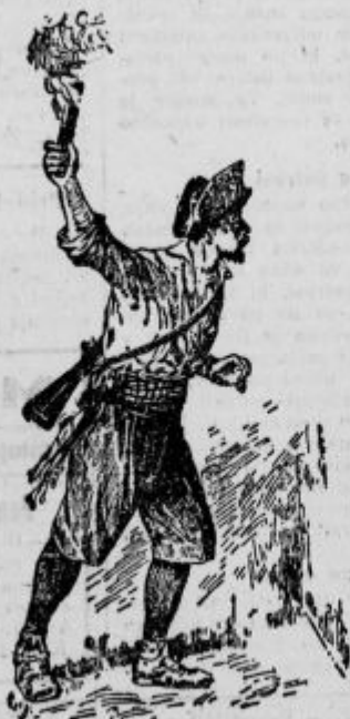
Eden izmed treh je hotel zažgati njuno kočjo.

Ti pa se nikakor niso hoteli pomiriti. Nagajali so jima na najrazličnejše načine. Enkrat so uničili njune njive, drugič so jima ustrelili domačo kozo z mladitci ali jima naredili kako drugo neprijetnost. Končno pa je izobčencema le poslo potrpljenje in sklenila sta, da bosta izzvala nasprot-