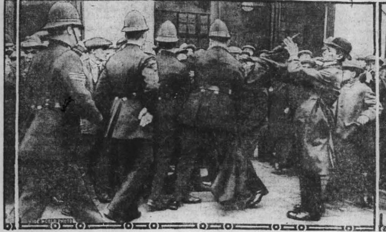
Med obravnavo londonskih komunistov, kateri so bili obdolženi komunistične propa- gande se je zbrala velika množica tovarišev z rdečo zastavo in drugimi radikalnimi znaki pred poslopjem, kjer se je vršila obravnava. Slika nam kaže neoboroženo policijo, katera razganja demonstrante.