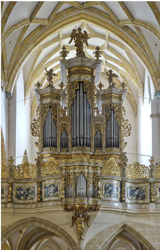
Sl. 14. Gospa Sveta (Maria Saal). Pogodbo za te orgle je Johann Martin Jäger podpisal leta 1735. (jd)

Gospa Sveta je bila med leti 753 in 945 sedež karantanskih škofov, ki so spadali pod nadškofijo Salzburg. Zato še danes cerkev imenujemo stolnica. Od leta 1116 naprej je bila cerkev v upravi kolegiatnega kapitlja. Tedaj so jo povečali in je dobila sedanjo gostsko osnovo. Leta 1674 so jo deloma barokizirali.