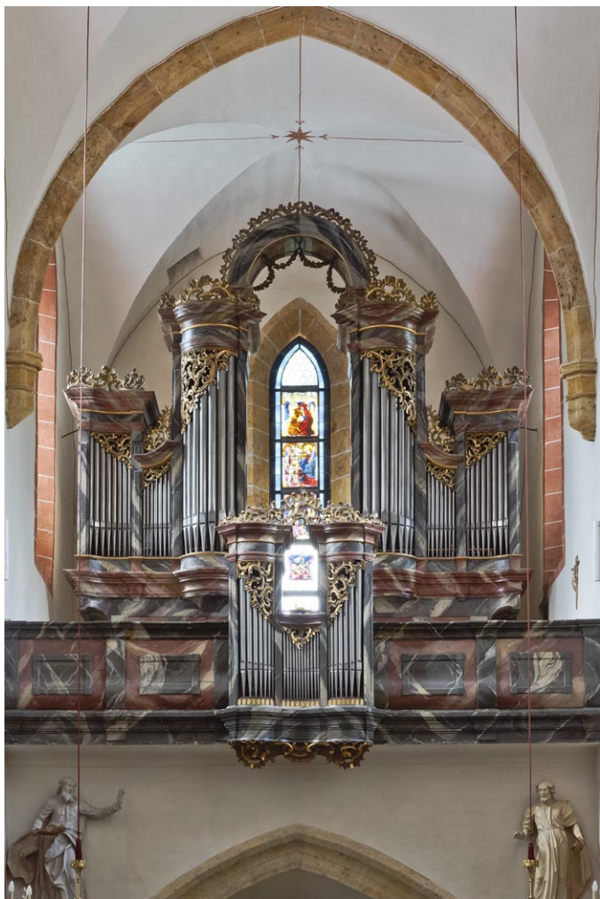
Sl. 15. Murau. (jd)