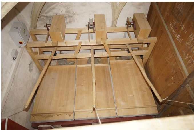
Sl. 18. Trije mehovi v Tamswegu nimajo puhala, ampak mehanizem, ki posnema ročno poganjanje. (jd)

Že leta 1849 pa je lokalni izvedenec poročal, da orgle niso skladne z načrtom.