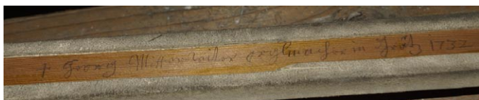
Sl. 5. Mitterreitherjev podpis na pokrovu sapnice v namiznem pozitivu pri sv. Jedrt v Bukovski vasi. (jd)

Mnoga dela Ferdinanda Schwarza so vsaj delno še ohranjena, na primer v Šentlenartu na Koroškem (Bad Sankt Leonhard, 1746, II/16), ter na Štajerskem Hartberg (1762, II/29) z ohranjeno omaro, Birkfeld (1765, II/24) in Koglhof (1767, II/14). Pravnuk ustanovitelja, Franz Xaver Schwarz , ki je delavnico vodil od 1772 do 1810, in se je vrnil k izdelavi hrbtnih pozitivov, je prav tako izdelal večje število velikih orgel, na primer za Weiz (1780, II/24), kjer je prav tako ohranjeno le ohišje. Mnogi pozitivni in enomanualne orgle delavnice Schwarz še danes igrajo po podeželskih cerkvah Štajerske in Koroške.