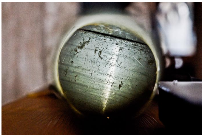
Sl. 7. Knollerjev podpis na spodnji strani jedra principalove piščali v stolnici v Krki na Koroškem. Fotografirano skozi odprtino noge.

Ignaz Grebičič (Grebtschitscher, 1696–1784) in sorodniki z