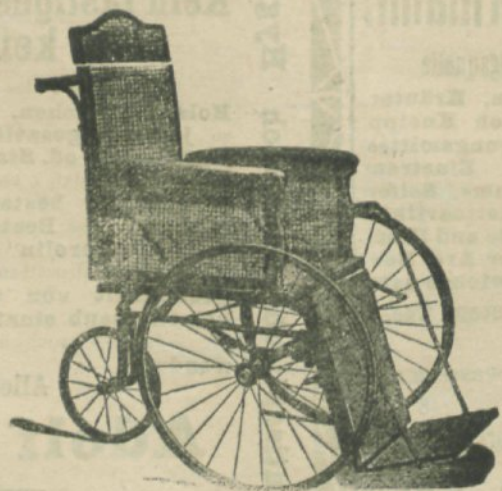
Krankenfahrräder für Zimmer und Straße.

Lieferant des österr. k. k. Staatsbeamten-Verbandes.