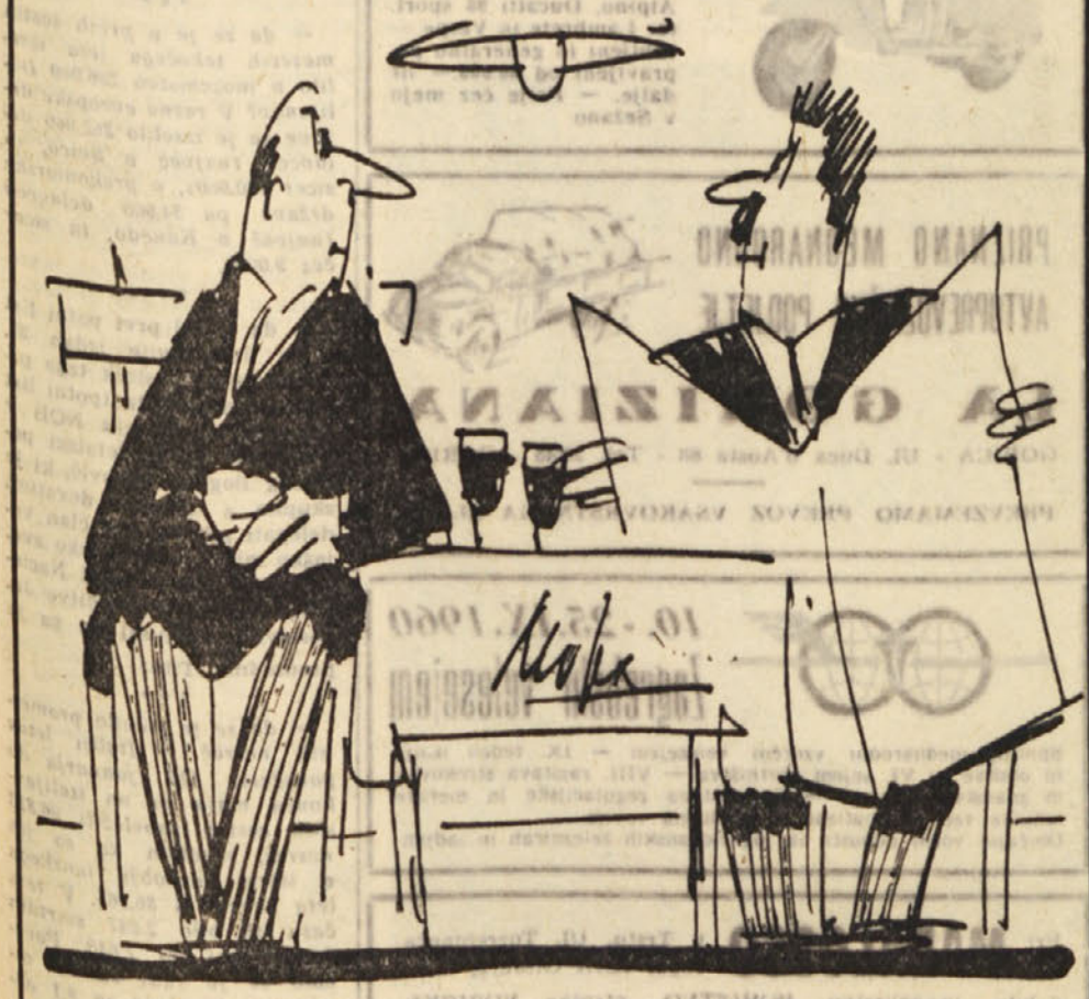
Po drugi strani pa moramo vendar nekaj storiti za obrambo pred fašizmom...