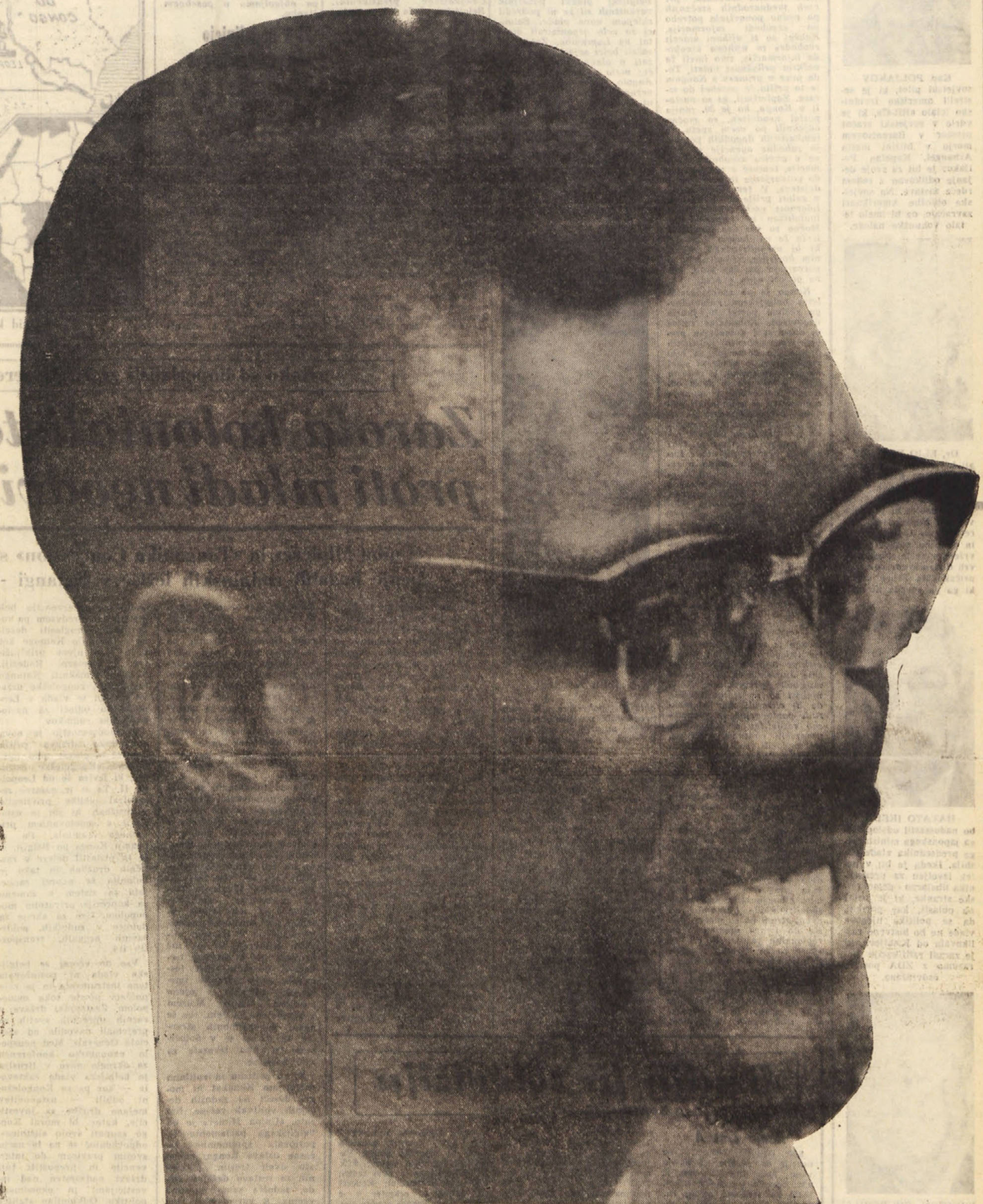
Patrice Lumumba, prvi predsednik vlade neodvisnega Konga, ki je zaprosil OZN za pomoč proti napadu belgijskih kolonialistov. (Glej poročila na 2. in 8. str.)