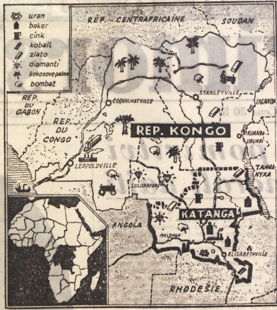
Zemljevid k prirodnim bogastvom pokrajine Katanga