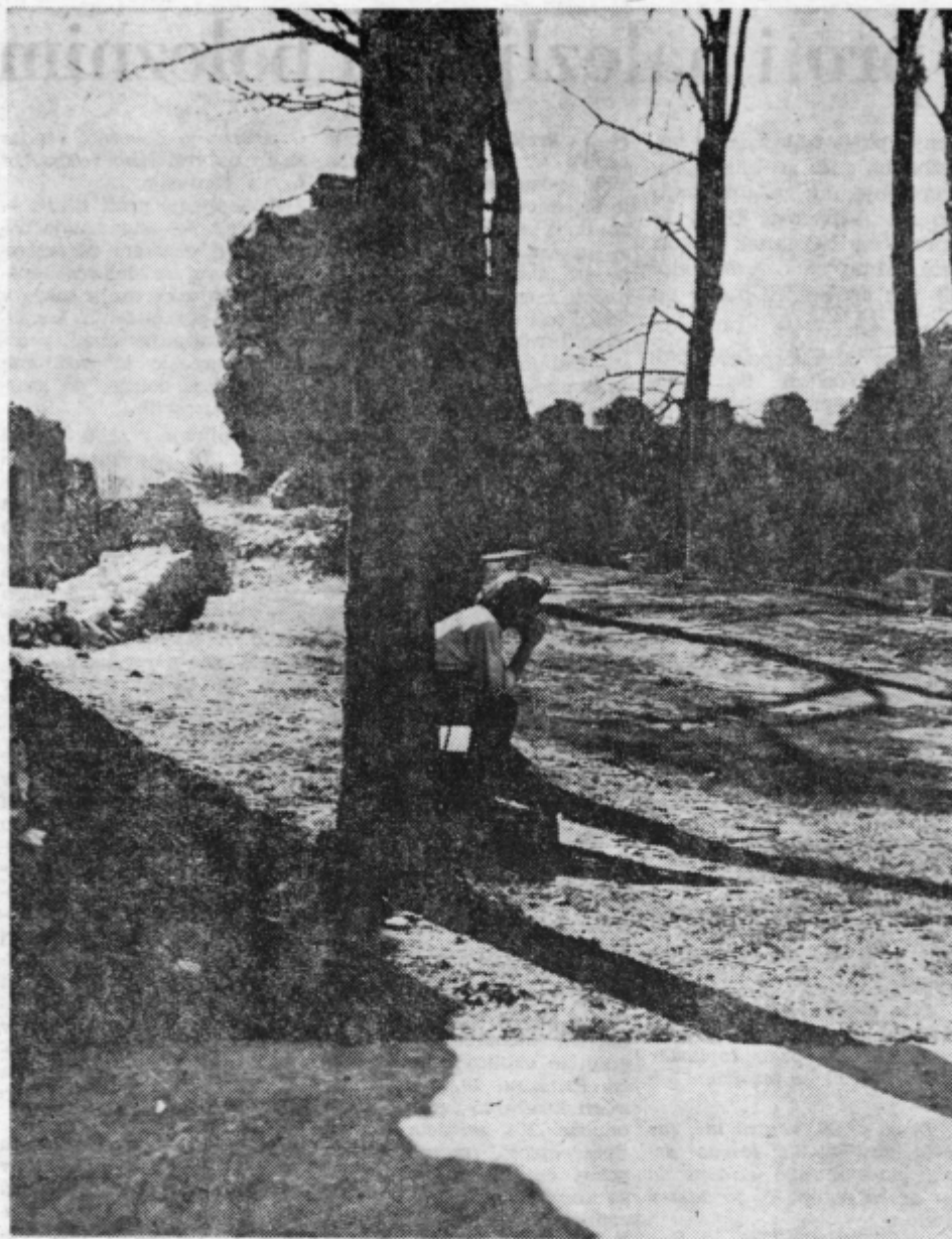
MED RAZVALINAMI CELJSKEGA GRADU — V prijetnih majskih dneh je prav, da malce bolj organiziramo tudi izletništvo. Samo letne počitnice so premalo, človek potrebuje tudi primeren oddih ob koncu tedna. In kje so urice kratke, prekratke, bolj prijetne kot prav v sproščeni izletniški družbi?

REPUBLIKA SKUPŠČINA KONSTITUIRANA — Devetega maja se je na sejah vseh petih zborov konstituirala republiška skupščina. Za predsednika so izvolili Sergeja Kraigherja, za predsednika izvršnega sveta pa Staneta Kavčiča. Izvolili so tudi predsednike zborov ter slovensko delegacijo v zveznem zboru (zboru narodov).