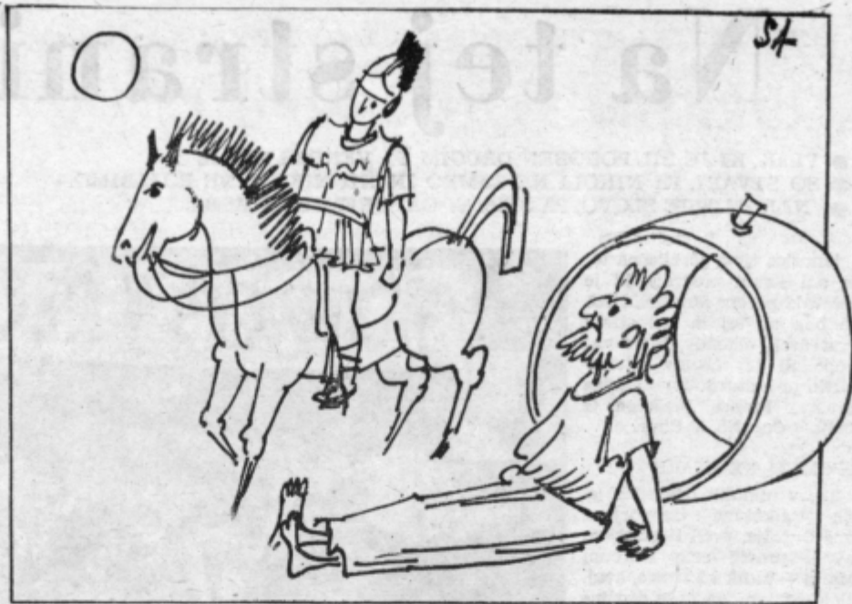
Kralj Aleksander: — Vidim, da živiš zelo skromno in da si revno oblečen. Zahtevaj od mene karkoli in ustregel ti bom. Diogen: — Ničesar si ne želim, toda če mi že res hočeš ustreči, te prosim — umakni se mi s sonca!