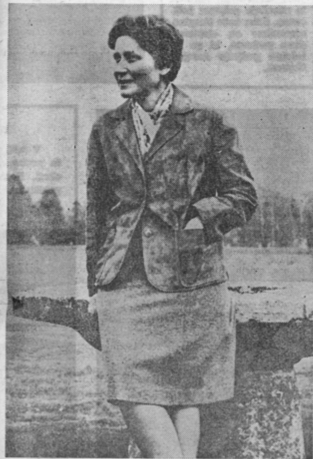
Stalinova hči Svetlana pred odhodom iz Svíce v ZDA.

Vietnamska vojna je torej, vsaj kot sedaj kaže, vsak dan bolj oddaljena od trenutka, ko bi začeli konkretno razpravljati o miru.