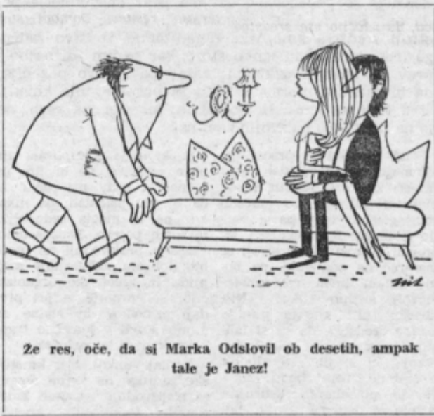
Ze res, oče, da si Marka Odslovil ob desetih, ampak tale je Janez!

Ko otrok shodi, zelo pogosto seda na tla, se na tleh igra in pogosto na tleh tudi zaspil. Zato mora biti pod tople, neloščen in ne spolzek. Idealen je pod, prekrit s preprogo iz bukleja, ki jo je mogoče prati s kakšnim dezinfekcijskim sredstvom. V sobah, ki nimajo takšnega poda, mora biti vsaj sredini prekrita s trdnjšo preprogo velikosti 2 krat 2 metra, pod njo pa tal ne smemo loščiti.