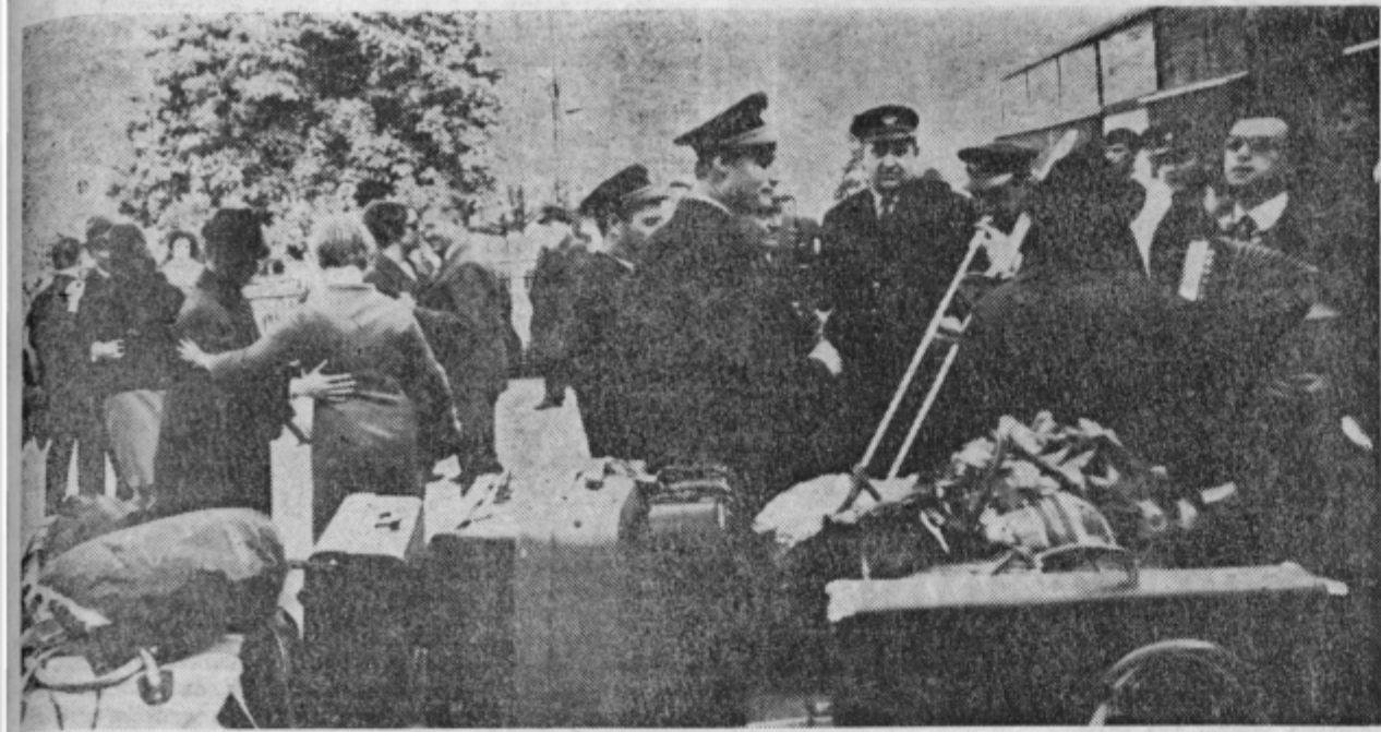
CELJANI NA OBISKU V ČUPRIJI. Reportažo berite na 4. strani.

GLASILO SOCIALISTIČNE ZVEZE DELOVNEGA LJUDSTVA