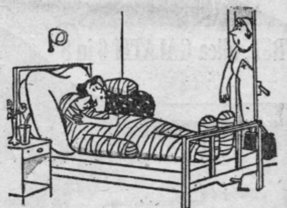
»Dovolite, vaš mož leži tam zraven!«

(Fran), 8. italijanski spolnik, 9. uradna kratica naše vojske, 10. stara anglosaška ploskovna mera, 11. ljubkolvalno žensko ime, 12. kratica slovenskega letalskega podjetja, 13. življenjska tekočina, 14. krompirjev olupke, 15. komandant slovenske partizanske vojske med NOB (Franc), 16. širna planjava v severovzhodni Sloveniji, 21. uradno ime Irske, 23. letovišče pri Opatiji, 27. ljubljanski dramski igralec (Ali), 29. redka kamenina, 32. kraljevo »pokrivalo«, 33. kuhinjska posoda, 35. latinsko: umetnost, 36. žensko ime, 38. naprava za električno prenašanje pogovorov, 41. nenaden sunek, 42. majhne vzpetine na travnikih, 43. zvočna alarmna naprava, 44. lepi mladenič iz grške mitologije, 46. hrib v Srbiji, znan po borbah v I. svetovni