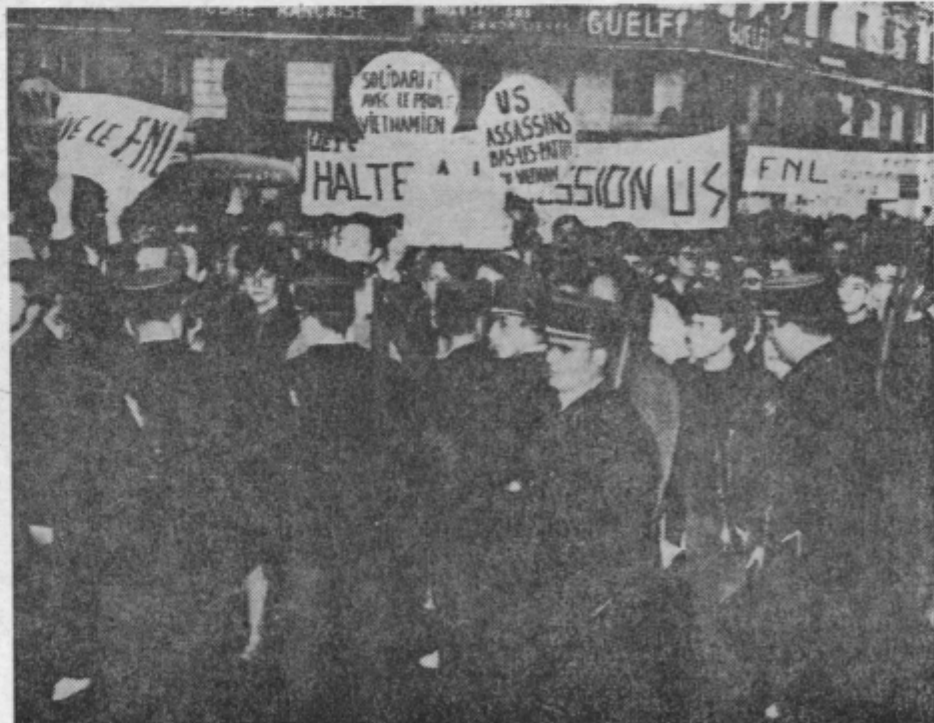
ZA MIR V VIETNAMU. Več kot petnajst tisoč Parižanov je 3. maja demonstriralo proti vojni v Vietnamu. Nekaj tisoč policajev je pazilo, da demonstranti ne bi prišli do ameriškega veleposlaništva. Francoska vlada je sicer že večkrat izredno ostro obsodila ameriško politiko v Vietnamu, ne dovoli pa, da bi demonstracije zaostrile njene odnose z Washingtonom.

Mnogi od prišlekov so se že tako udomačili na Tai- vanu, da so pozabili na celin- sko Kitajsko. Razen tega pa je v armadi tri četrtine pravih Taivancev, in najbrž ne bi bilo razumno domnevati, da bi bili ti ljudje pripravlje- ni iti v vojno za »vrnitve« de- žele, ki je ne smatrajo za svojo domovino.