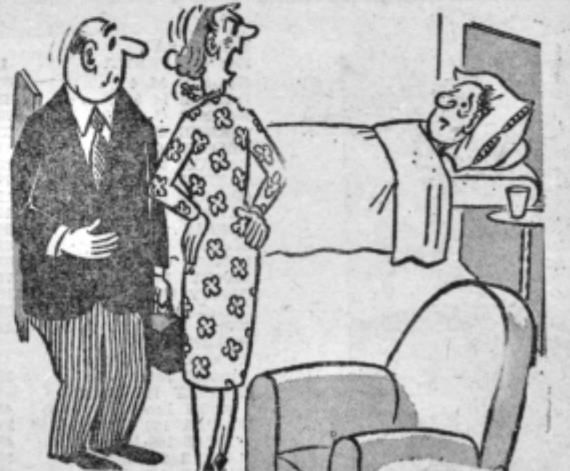
»Doktor, bi lahko spet enkrat jedel dober zrezek?« — »Molči, kdaj pa je še kdo tik pred smrtjo govoril o zrezkih!«

vojni, 48. žensko ime, 49. pritok Save na Gorenjskem, 50. tujka za ploščino, površino, 53. naziv za človeka z velikimi očmi, 55. žensko ime, 57. določene barve, 59. uradni spis, 61. okrajšava za kozinus v geometriji, 63. avtomobilska oznaka Sarajeva, 65. samo.