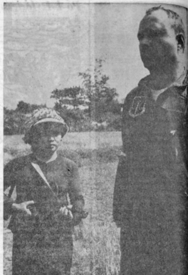
VSE LJUDSTVO SE JE DVIGNILO — V obrambi pred napadi ameriških letal sodeluje vse vietnamsko ljudstvo. Med pripadniki ljudske milice, ki je vedno v prvih obrambnih vrstah, je tudi veliko žensk. Na sliki: pripadnica ljudske milice je ujela ameriškega pilota.

Moji sklepi so formalni in prav taki kot ugotovitve vseh opazovalcev, ki žive v Hanoi: bombardiranje terja človeške in materialne žrtve, vendar pa nikakor ni dosegljivo cilja, ki so si ga zastavili Američani, namreč, da bi z bombami demoralizirali Severni Vietnam, mu preprečili, da bi pomagal Jugu in ga naposled pripeljal h konferenčni mizi. Po mojem je res celo nasprotno: bombardiranje je utrdilo notranji in zu-