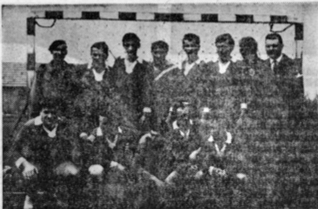
Rokometaši Petrovc, ki tekmujejo v štajerski rokometni ligi, letos na start spomladanskega tekmovanja niso bili preveč dobro pripravljani. Upajo pa, da bo v nadaljevanju bolje in se bodo menda prerinili vsaj v sredino lestvice.

Cez Dobrovlje so se udeleženci pohoda vračali v Savinjsko dolino polni vtisov o zgodovinskih dogodkih, vtisov, ki si jih bodo prav gotovo zapisali v spomin. P.