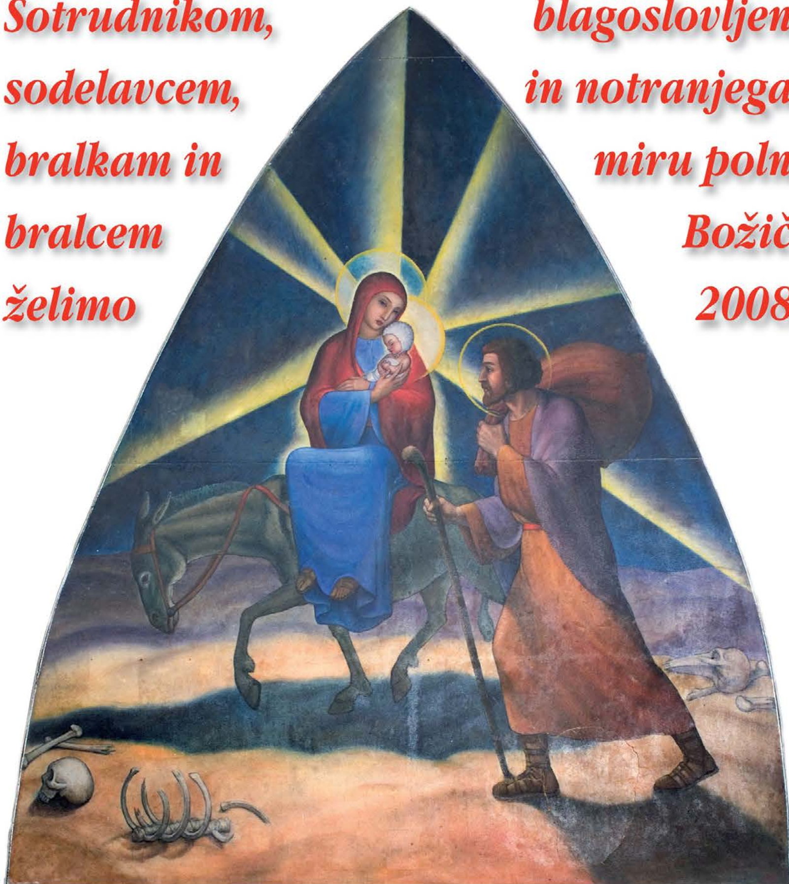
Tone Kralj, Beg v Egipt, cerkev na Sv. Višarjah

blagoslovljen in notranjega miru poln Božič 2008