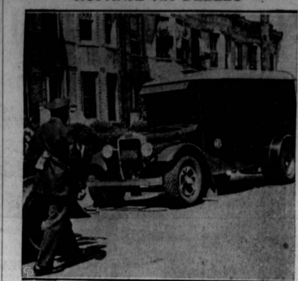
Tudi ameriški roparji so se "reformirali" in iščejo prilik za "kričeti na debele". Dne 21. avgusta so napadli oklopni avto v New Yorku, iz katerega so pobrali nad štiri sto tisoč dolarjev. Pravijo, da je to najvišja vsota, ki je bila kdaj ukradena na roparski način. Tatvina je bila izvršena popolnoma ob jasnem solnčnem dnevu, v brooklynskem predelu newyorškega mesta. Šele ko so tatovi odpejali svoj visoki plen v avtih do obrežja in se potem vkrcali z denarnimi vrečami v motorne čolne, se je začel za njimi pogon, ki še traja, kajti "izginili so brez sledu". Na sliki je oklopni avto (s katerim pobirajo v trgovinah denar za v banko, ali pa ga jim dovažajo) na mestu, kjer je bil izvršen rop.

rablja vse svoje socialistične principe.