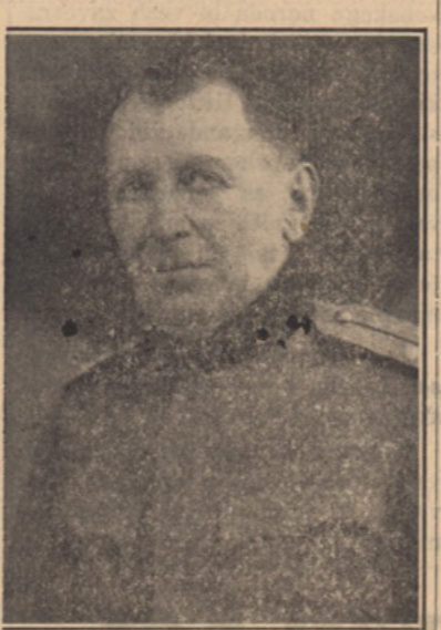
POK. F. SPRAGER

šo, da ni bilo prodana. Nehvaležnost je plačilo sveta! Atek je hodil k Vargeronu v oljarno — jaz sem gospodinjila in po milosti